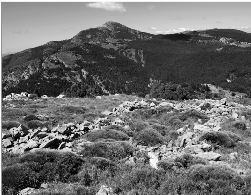
Marinet. Planell de la mola, amb Penyagolosa al fons.

de funció defensiva també han pogut fer de tanca ramadera, com en altres punts de les comarques castellonenques.