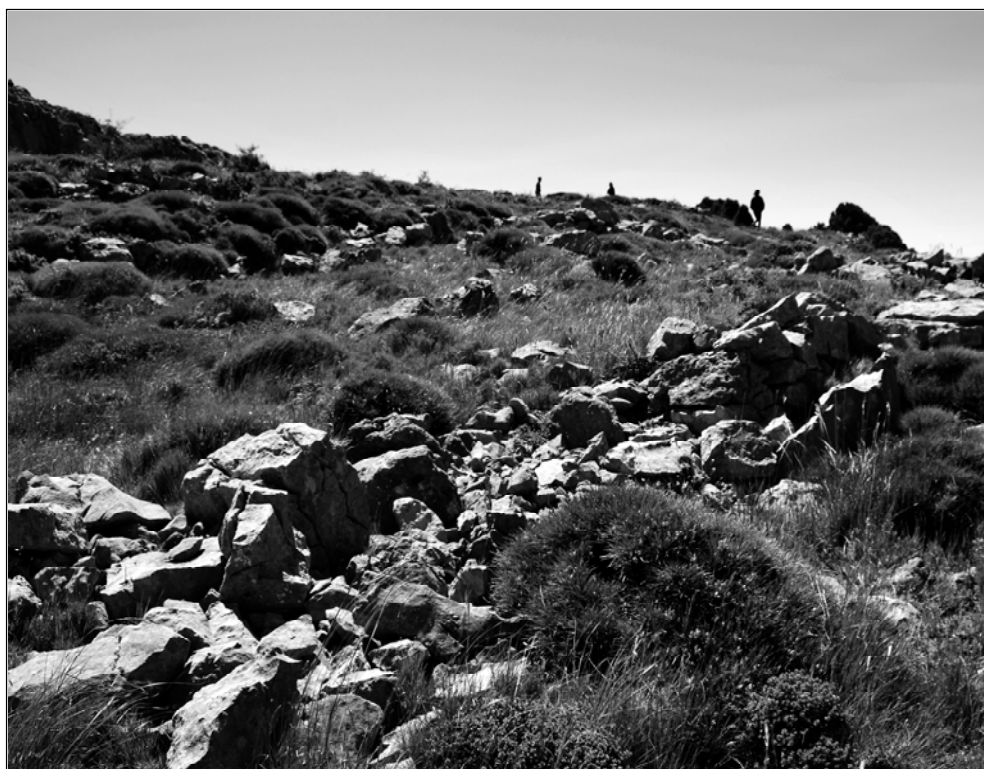
Marinet. Despulles de construccions.

Les diferents versions sobre l'Encant són així: