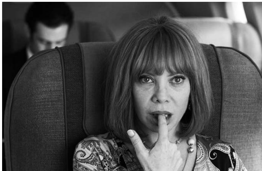
Los amantes pasajeros

cer una imagen de nuestro país que finge burlar los tópicos pero se regodea en ellos, que aparenta modernidad pero