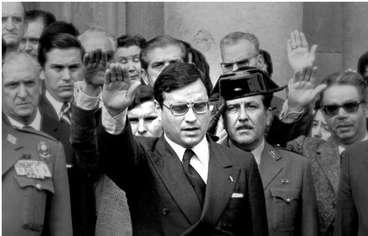
Cubillo. Historia de un crimen de Estado

múltiples máscaras. Por un lado, anclada en el individuo y sus relaciones más inmediatas (la pareja), como es el caso de Si fuera fácil ( This Is 40 , Judd Apatow, 2012), que aborda la crisis de los 40 sin preocuparse en exceso de los aspectos contextuales y pretende ser una comedia adulta de autor, pero hollywoodiense, lo cual es muy atractivo en el plano teórico, y responde fielmente a las virtudes y los problemas del cine de Apatow: un deseo de contentar y al mismo tiempo un esfuerzo por la profundidad, que dan como resultado un nivel desmedido en los diálogos y una irregularidad manifiesta. Nos tememos que el director está excesivamente sobrevalorado por cierta crítica, pese a que consigue transmitir el reflejo del malestar vivencial que pretende.