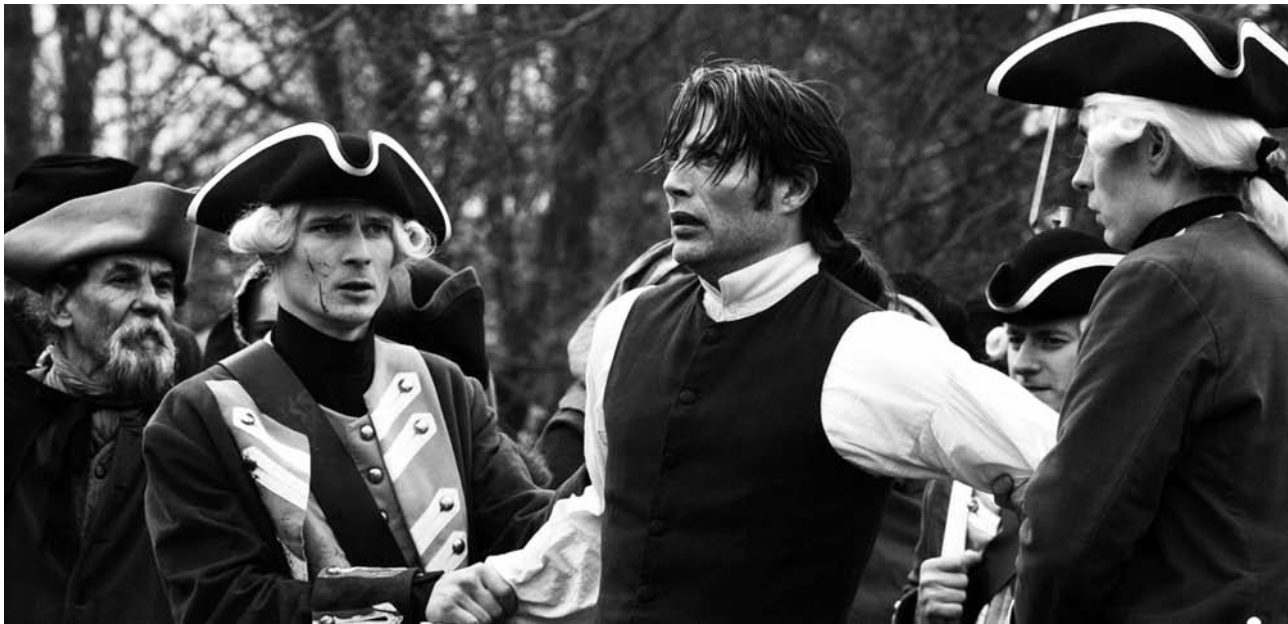
Un asunto real

eficaz, sin barroquismos, muy en la línea de un cierto clasicismo que hoy nos parece reivindicable por su contundencia, la película cumple a la perfección sus objetivos y nosotros, aplicando su trama a nuestra actualidad, vemos cómo la conciencia social se ha ido manipulando una y otra vez con cortinas de humo y mentiras sin límite, pero aquí nadie dimite ni asume sus responsabilidades (salvo el Papa). Las maniobras que llevaron hacia atrás al pueblo danés, son similares a las que ahora nos