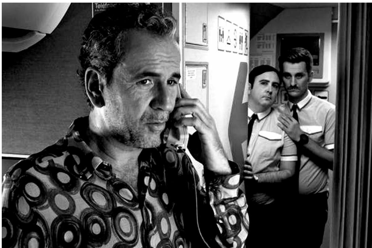
Los amantes pasajeros

cación). Durante la segunda legislatura de Zapatero, prefirió centrarse en hacer melodramas oscuros, abstraídos y autorreferenciales que, todo sea dicho, no estaban nada mal ( Los abrazos rotos , La piel que habito ). Por fin, tras la llegada al poder por parte de Rajoy, ha admitido que se equivocó apoyando a ZP en la campaña para su segundo mandato, que constituyó, a su juicio, “un auténtico desastre”. Al hilo de lo cual, se ha descolgado con esto.