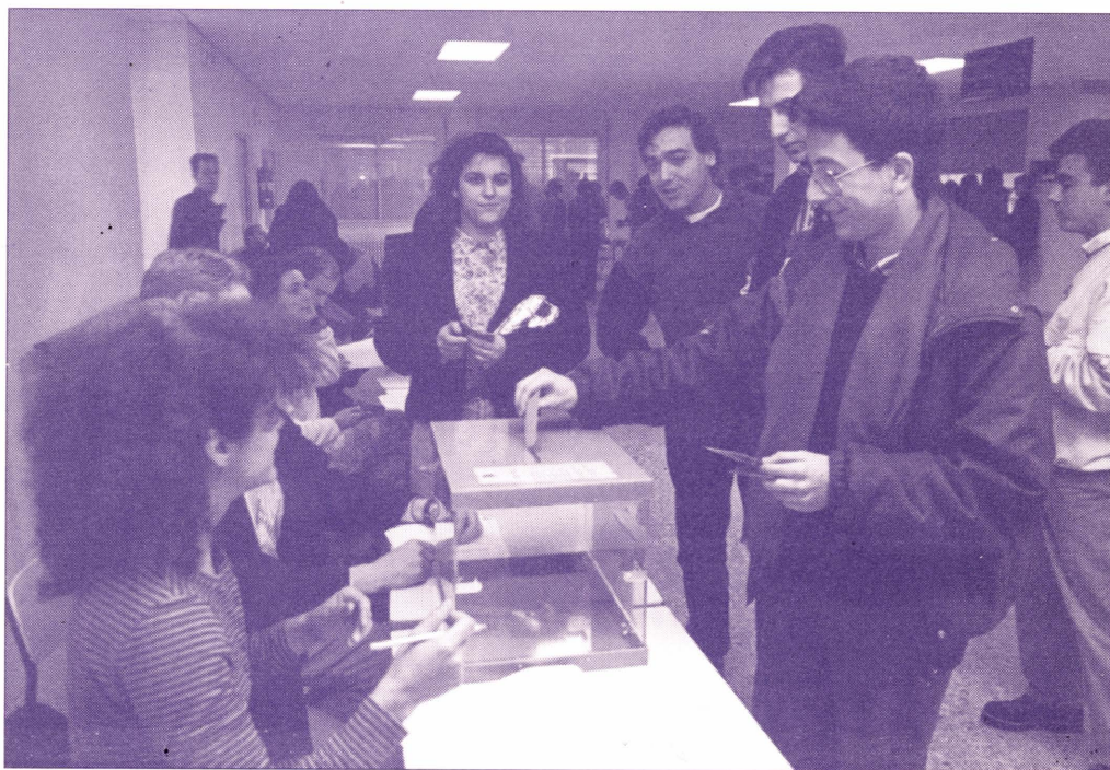
Aquestes eleccions garanteixen la gestió dels estudiants als centres

La junta de centre és l'òrgan màxim de representació, decisió i control de les facultats i de l'escola. La componen, com a membres nats, el degà o director, que la presideix, els vicepresidents de les comissions interdepartamentals de titulació (CIT) i els directors i coordinadors de departaments i unitats predepartamentals. Els membres electes es distribueixen de la següent manera: 21 persones elegides entre el personal docent i investigador del centre; 12 estudiants que cobreixen la representació de totes les titulacions i que es distribueixen proporcionalment en funció de la matrícula; finalment, 5 membres representants del personal d'administració i