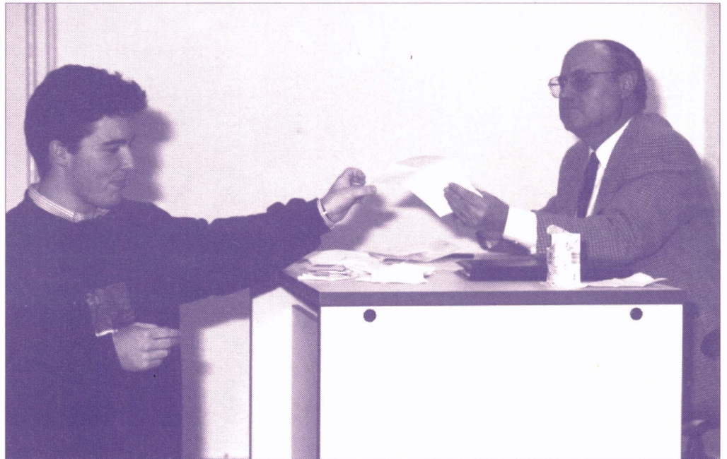
Els estudiants de l'UJI tenen la possibilitat d'accedir als departaments

D urant el mes de desembre se celebraran les eleccions a representants estudiantils per als departaments i unitats pre-departamentals. Una vegada elegits els delegats de grup, aquest sufragi, que també es va efectuar en els cursos anteriors, és un instrument més per a la democratització interna de la Universitat.