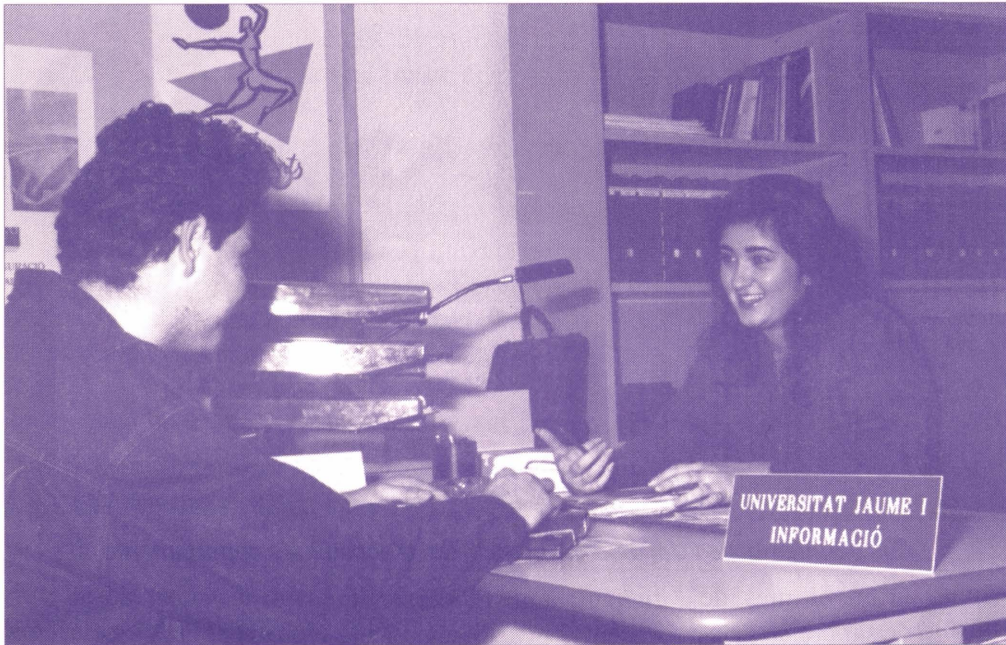
La prestació social substitutòria pot fer-se també a l'UJI

La Universitat Jaume I i l'Oficina per a la Prestació Social dels Objectors de Consciència han establert un concert de col·laboració que permet realitzar la prestació social substitutòria en activitats acadèmiques i serveis de suport de la comunitat acadèmica. Si estàs per la feina, en el SASC tenen tota la informació que necessites.