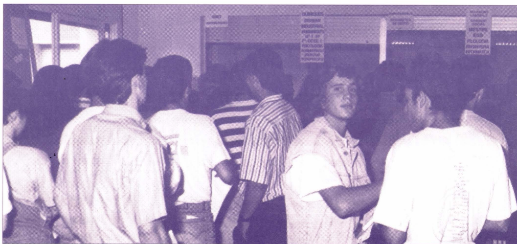
Els estudiants de la Universitat Jaume I no tenen aquest curs pujada de taxes

El decret modifica, per tant, les taxes fixades pel decret anterior, de 31 d'agost. Les tarifes queden de la següent manera: els crèdits de les noves titulacions de pla nou passen a valer de 1.360 pessetes a 1.214 pessetes per a les titulacions tècniques i la llicenciatura en Ciències Químiques. En la resta de titulacions de la Universitat