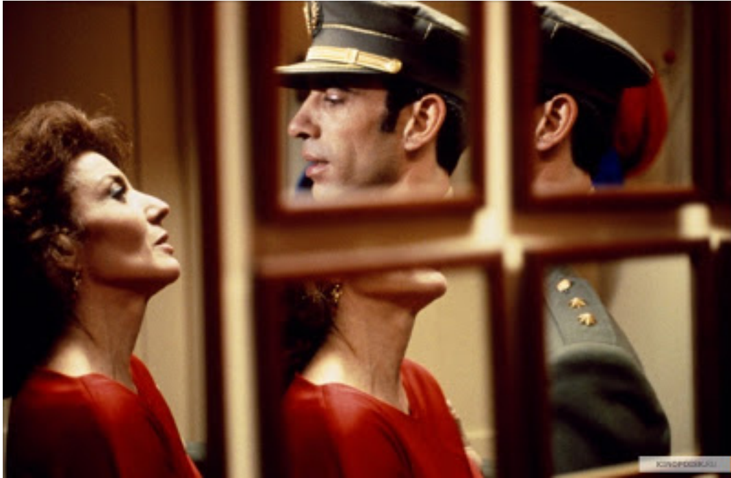
La flor de mi secreto , Pedro Almodóvar, 1995