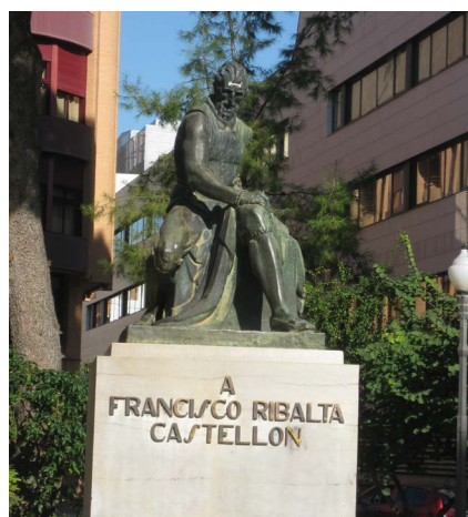
Figura 1. Estatua a Francisco Ribalta

En el año 1876, siendo alcalde D. Domingo Herrero, se acordó en el pleno municipal construir, junto al entonces paseo Ribalta, el paseo del Obelisco, llamado en su día de la Alameda (pleno del