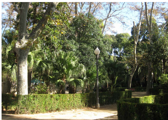
Figura 2. Detalle del interior del parque

El diseño es muy original, lleno de plazoletas con bancos de cerámica a los que se llega por sinuosos pasillos, componiendo todo él un complejo de la-