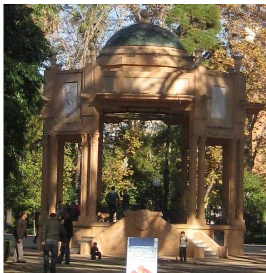
Figura 3. Templete

El paseo del Obelisco es el paseo preferido de los castellonenses por estar en el centro del paseo. Está rodeado de un banco circular que invita a sentarse y la diagonal. Es por eso por lo que en 1899 se instala en la parte oeste del círculo el primer kiosco de venta de helados y refrescos; es el tradicional kiosco Campos, que duró hasta 1991. El señor Arruzat,