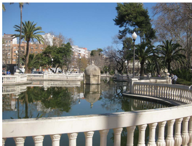
Figura 5. Estanque del parque

En el paseo del Obelisco, a la altura del estanque, se ubicó durante un tiempo una locomotora de tren