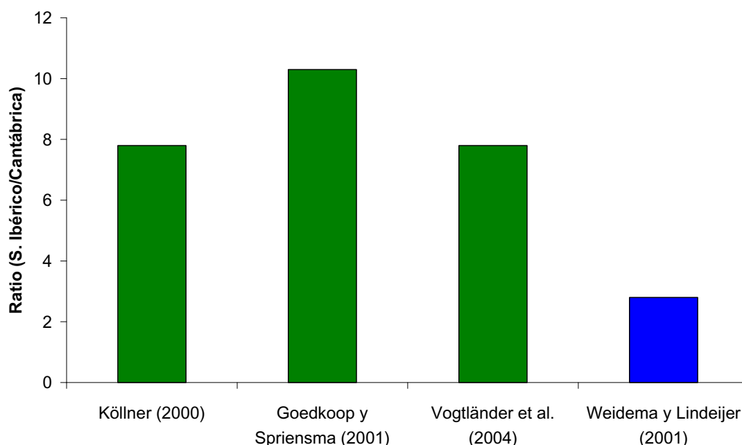
Figura 1. Ratio del impacto del uso del suelo sobre la biodiversidad, por metodología.

A la luz de estos resultados, se puede considerar que, para un cambio en el uso del suelo, el impacto sobre la biodiversidad es mayor en los bosques del Sistema Ibérico, ya que en ellos habita un mayor número de especies de plantas vasculares. En los tres primeros métodos, las ratios entre los impactos que causa el reemplazo por un campo de cultivo en un área y otra son similares, resultando éste mayor en el Sistema Ibérico por factor aproximado de 8. Esto es debido a que los tres métodos utilizan bases metodológicas comunes (Köllner, 2000). Sin embargo, la aplicación del método de Weidema y Lindeijer (2001) resulta en una ratio considerablemente diferente, próxima a 3. Esta diferencia podría atribuirse al uso de fuentes de datos diferentes y al hecho de que el método utiliza otras variables para evaluar el impacto, tales como la escasez y la vulnerabilidad de los ecosistemas citadas anteriormente. La figura 1 muestra los valores de los ratios entre impactos de forma gráfica.