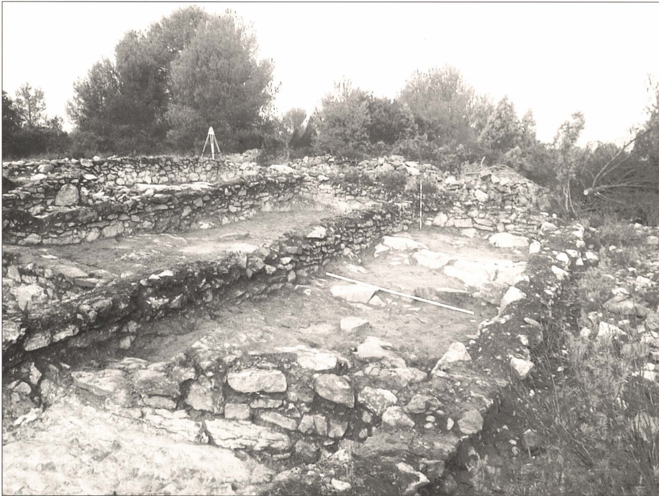
Figura 2. "Edifici C", vist des del sud.

La estança C6 la considerem com a vestíbul d'accés a la unitat principal de la casa que seria la estança C3; amb les restes de la llar i un enterrament en urna sota el seu paviment com a indicis més evidents de la centralitat d'aquesta estança. Queda clar aleshores, que en la nostra hipòtesi les entrades a les dependències d'aquest edifici es farien pel vessant sud-oest, just la que queda per excavar.