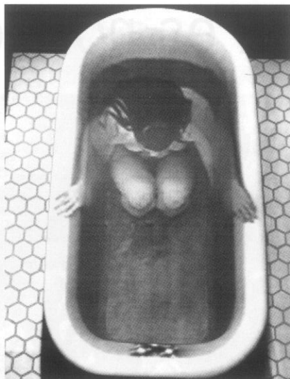
Una obra d'Army Jenkins, artista que centra el seu treball artístic en la identitat femenina.

El feminisme del segle XXI revoluciona el món artístic sobretot pel que fa a l'experimentació amb els cossos. Amb la teoria queer , la identitat s'ha tret un gran pes de sobre ja que destrueix qualsevol associació biològica o essencial a l'orientació sexual o de gènere. I això es reflecteix molt clarament en l'expressió artística. Per exemple, en les darreres creacions eròtiques i pornogràfiques flueixen líquids corporals, plaers, llibertats sexuals, paraules