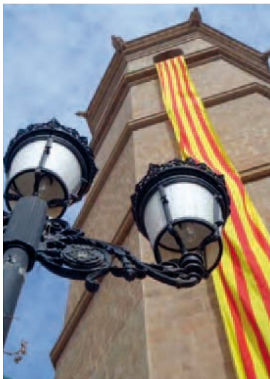
El Campanar de la Vila, el Fadri

Veig, i no sóc endeví, una difícil solució pels temes econòmics de les gaiates i implicació personal a les Comissions de Sector, veig més difícil encara aconseguir agilitat en els actes, major implicació i participació de les