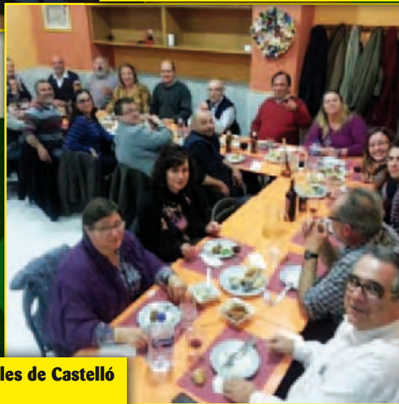
Sopar de representants Federació Colles de Castelló 15/02/13