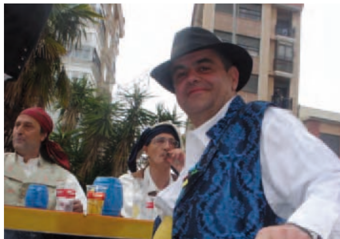
Pregó Magdalena 2011

La creació d'esta Junta de Festes, amb el concepte d'obertura i participació en l'organització i programació de la nostra setmana fundacional, va suposar sens dubte un revulsiu en el món de la festa de la nostra ciutat i ha contribuït en gran manera a l'auge que ha anat adquirint la nostra setmana magdalenera fins a convertir-se en una celebració de referència internacional. A això han contribuït també en gran manera les colles, que representen un element molt característic i determinant de les nostres festes. I va ser precisament sota el mandat d'aquella Junta de Festes quan les colles van iniciar el procés d'unió en una federació tal com havien fet uns mesos abans les comissions de sector amb la Gestora de Gaiates. L'auge de festa popular, de festa