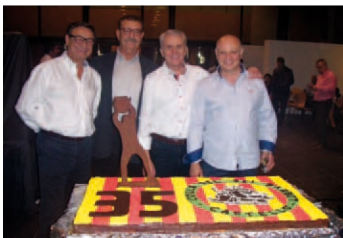
35 aniversari Rei Barbut