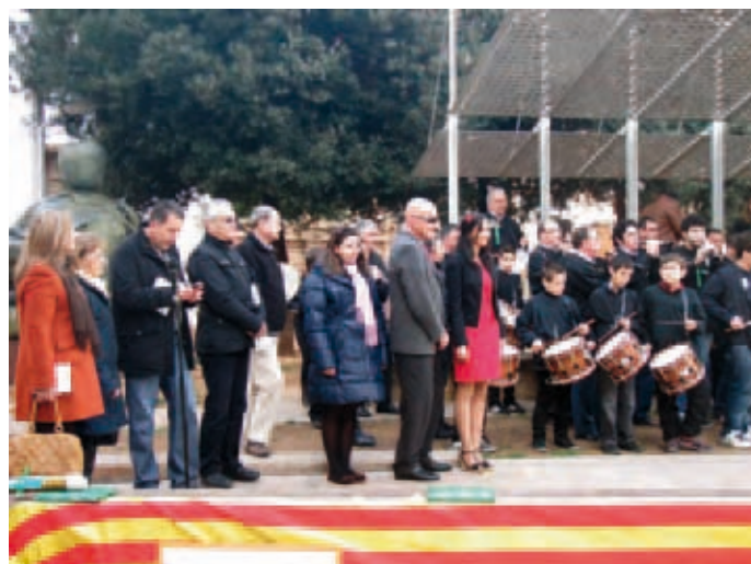
Madriñes i autortitats

Escola Municipal de Dolçaina i Tabal de Castelló