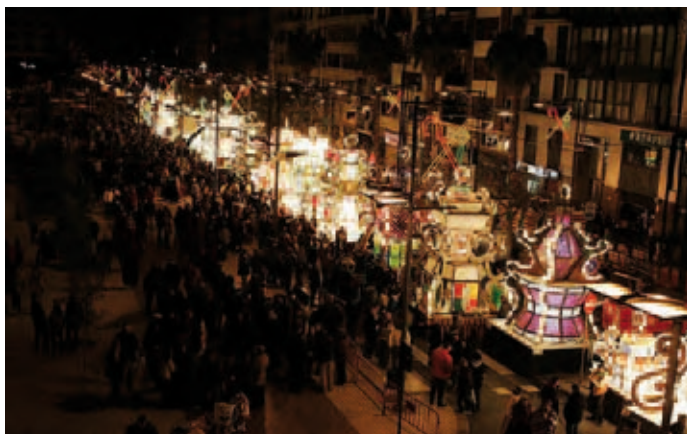
Encesa de Gaiates

haurà de procedir posteriorment a la seua inscripció en el registre corresponent. En els estatuts derogats la titularitat de la denominació gaiatera i els distintius corresponia a la Junta de Festes.