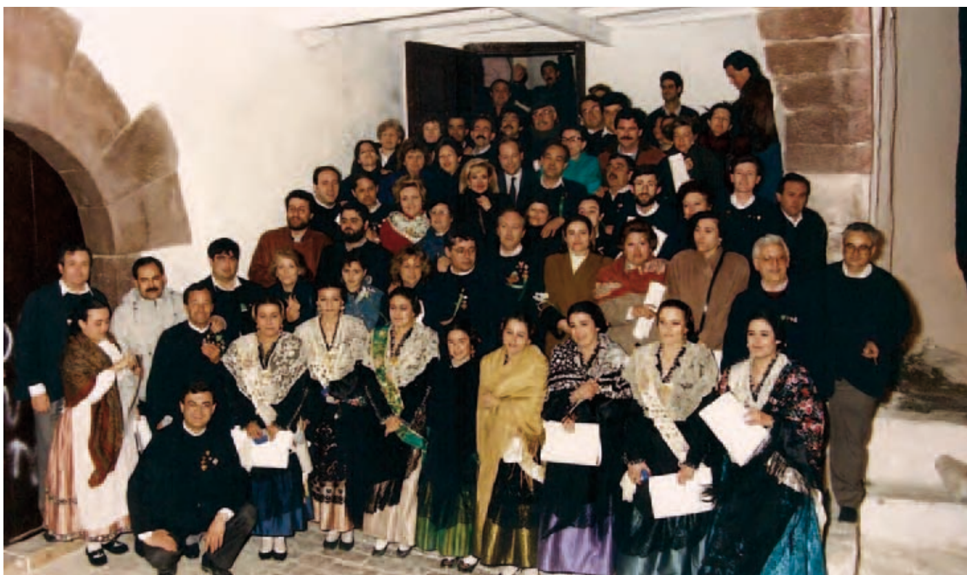
Vítol Magdalena 1990