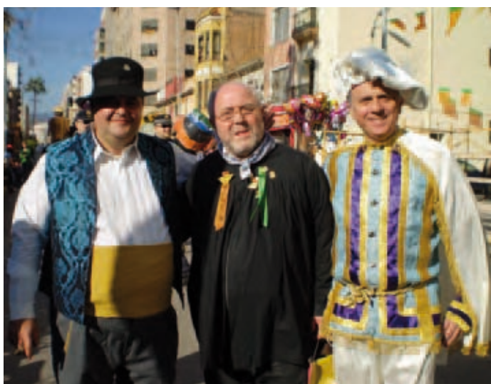
Pregó Magdalena 2008

Per tot això, em resulta especialment gratificant poder dedicar unes paraules a tots els amics i amigues de la Federació de Colles en estes festes de la Magdalena en què celebrem el primer quart de segle d'aquella Junta de Festes original en què vaig tindre la sort de participar i que va col·laborar sens dubte també en el protagonisme creixent que han tingut les colles en la nostra setmana gran. Estic convençut que este camí que portem transitant durant els últims 25 anys és pel qual hem de seguir i que per aquest veurem com les nostres festes adquirixen encara més brillantor i esplendor en el futur. Bones festes a tots els socis i sòcies de les Colles perquè sens dubte tots ells són grans protagonistes de les nostres festes més grans, les Festes de la Magdalena.