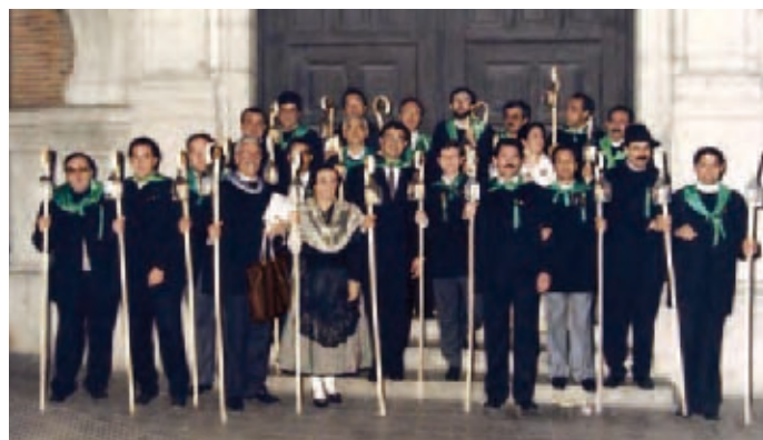
Junta de Festes 1989 - 1990