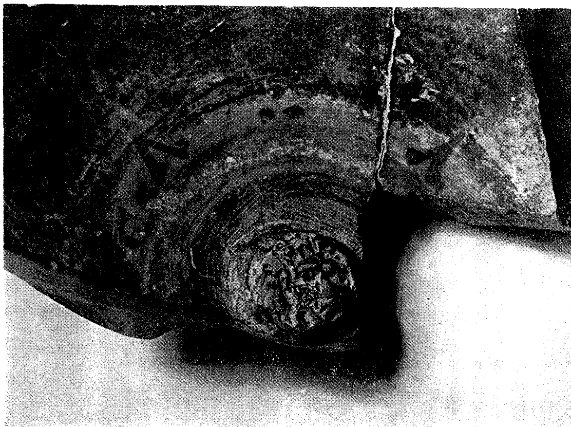
1. — Aspecto del interior de la pátera