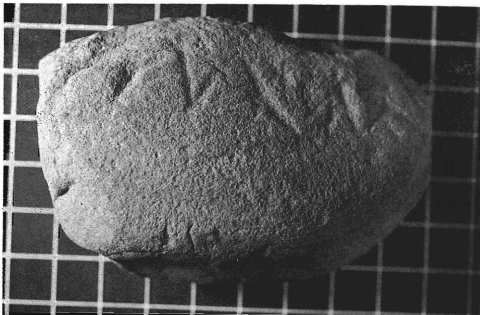
Inscripción ibérica de la necrópolis de Orleyl, en piedra.