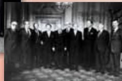
Foto de familia, Dublín, 10 y 11 de marzo de 1975.