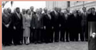
Primer Consejo Europeo tras la entrada en vigor del Acta Única Europea, Copenhague, 4 y 5 de diciembre de 1987.

El Consejo Europeo se inscribe en el Acta Única Europea.