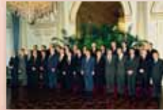
Primer Consejo Europeo tras la entrada en vigor del Tratado de Maastricht, Bruselas, 10 y 11 de diciembre de 1993.

Las funciones del Consejo Europeo se definen en el Tratado de la Unión Europea (Tratado de Maastricht).