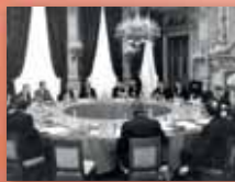
Sesión de trabajo, París, 9 y 10 de diciembre de 1974.