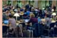
El Centro de Prensa durante una sesión del Consejo Europeo.