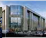
El edificio Justus Lipsius, sede actual del Consejo Europeo.