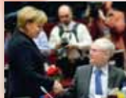
El Presidente del Consejo Europeo, Herman Van Rompuy, con la Canciller alemana, Angela Merkel, durante el Consejo Europeo de los días 16 y 17 de diciembre de 2010.

Entra en vigor el Tratado de Lisboa: el Consejo Europeo se convierte en una institución y su presidente es elegido por un periodo de dos años y medio.