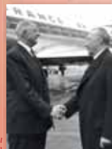
El Canciller Konrad Adenauer recibe al Presidente Charles de Gaulle con motivo de la cumbre de Bonn del 18 de julio de 1961.