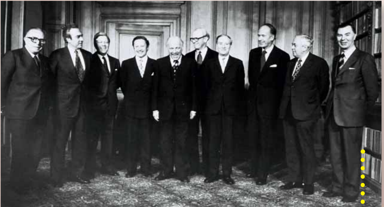
Foto de familia, Dublín, 10 y 11 de marzo de 1975.

«La necesidad de adoptar un planteamiento global de los problemas internos que plantea la construcción europea y de los problemas que se le plantean a Europa en el exterior» (4) está en el origen de esta creación. Se asigna así al Consejo Europeo la función de imprimir un impulso político, tanto en el ámbito comunitario como en materia de cooperación política. A partir de ese momento, los Jefes de Estado o de Gobierno, acompañados por los Ministros de Asuntos Exteriores, se reunirán «tres veces por año y cada vez que resulte necesario» (5) .