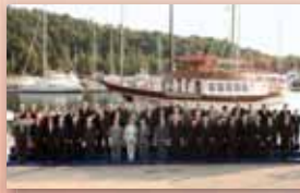
Foto de familia, Salónica, 19 y 20 de junio de 2003.

El Consejo Europeo se reúne por última vez en el país que ocupa la presidencia; en lo sucesivo lo hará siempre en Bruselas.