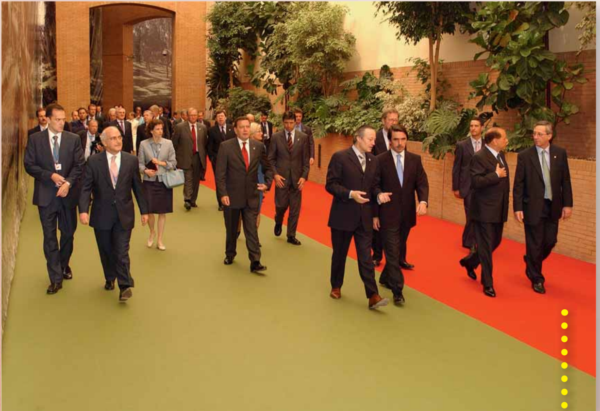
Consejo Europeo de Sevilla, 21 de junio de 2002.

sidida por Luxemburgo, una declaración que instauró un periodo de reflexión de un año. Atendiendo a lo acordado en el Consejo Europeo de junio de 2006 , celebrado bajo la Presidencia de Austria, los Jefes de Estado o de Gobierno adoptaron, con motivo del cincuentenario del Tratado de Roma, una declaración en la que se fijaron el objetivo «de dotar a la Unión Europea de fundamentos comunes renovados de aquí a las elecciones al Parlamento Europeo de 2009». En el Consejo Europeo de junio de 2007 , bajo la Presidencia de Alemania, se acordó el mandato de una conferencia intergubernamental encargada de modificar los Tratados existentes. El Tratado resultante de los trabajos de esta conferencia se firmó en Lisboa el 13 de diciembre de 2007.