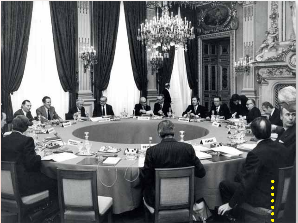
Sesión de trabajo, París, 9 y 10 de diciembre de 1974.

por la que se dotó a la Comunidad de recursos financieros propios, para la puesta en marcha de la cooperación en política exterior (la cooperación política europea que se inició con el primer «Informe Davignon») y para la adhesión de Dinamarca, Irlanda y el Reino Unido. El conjunto de estos avances es lo que se conoce hoy con el triplete «realización, profundización, ampliación». Los tres nuevos miembros fueron invitados a participar en la cumbre convocada en París en octubre de 1972, a pesar de que su adhesión oficial no tuvo lugar hasta enero de 1973.