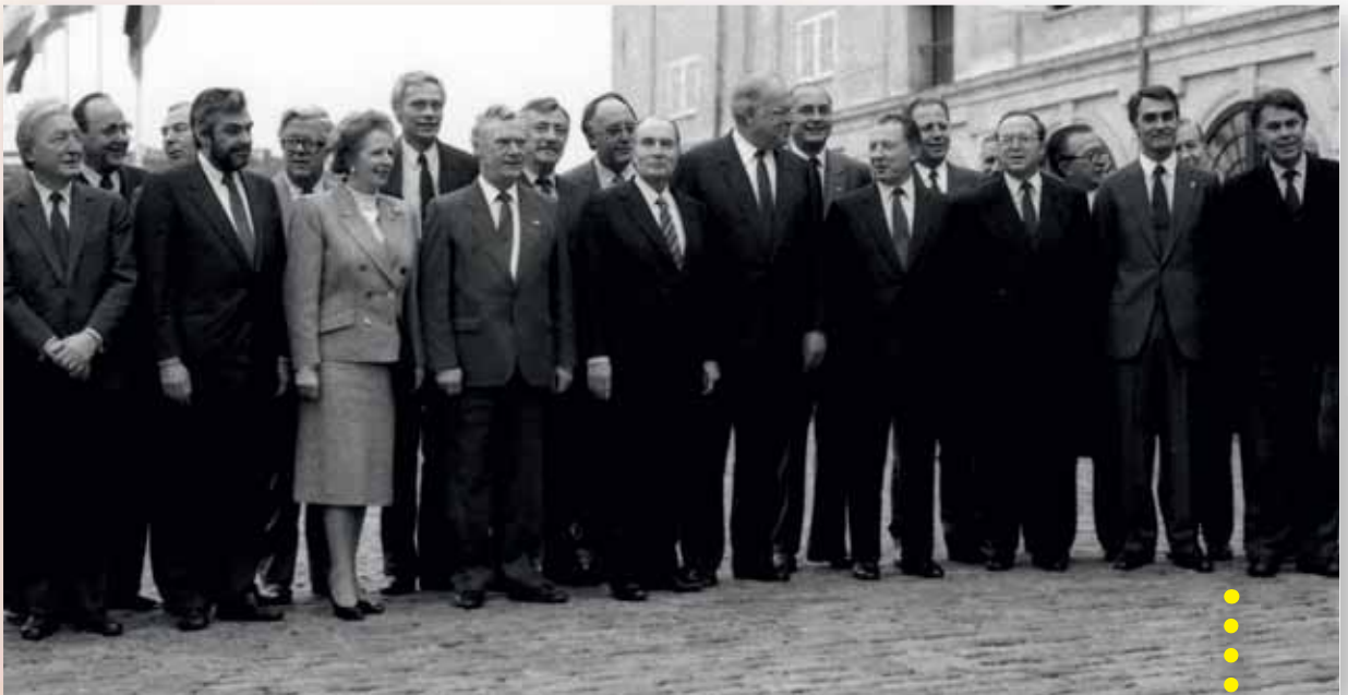
Primer Consejo Europeo después de la entrada en vigor del Acta Única Europea, Copenhague, 4 y 5 de diciembre de 1987.

Por otra parte, este Tratado asentó la función del Consejo Europeo en las relaciones interinstitucionales. Oficializó la práctica de que el Consejo Europeo fuera presidido por el Jefe de Estado o de Gobierno del país que ocupase la Presidencia del Consejo. Además, haciéndose eco de la evolución de las competencias del Parlamento Europeo, el Tratado estipuló que el Consejo Europeo debía presentar al Parlamento un informe al término de cada una de sus reuniones y, todos los años, un informe escrito sobre los progresos realizados por la Unión.