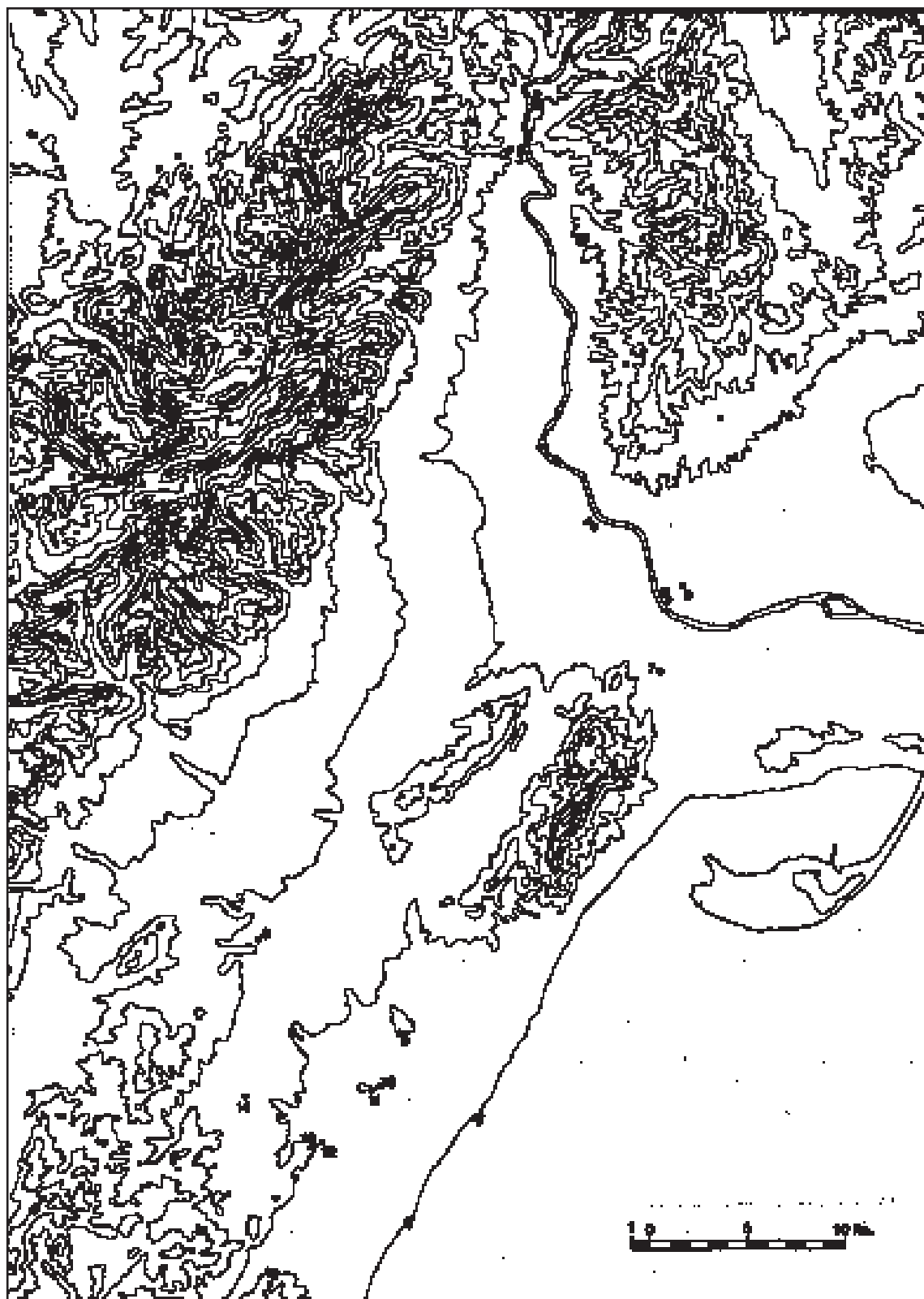
Figura 3. Mapa de distribució dels jaciments durant el segle VI anE: 1.- El Martorell; 2.- Castellot de la Roca Roja; 3.- Barranc de les Fonts; 4.- Necròpolis de Mianes; 5.- Tossal Redó; 6.- Necròpolis de Mas de Mussols; 7.- Necròpolis de l'Oriola; 8.- Necròpolis del Mas de Caperó; 9.- Puig de la Misericòrdia; 10.- Necròpolis del Puig de la Nau; 11.- Puig de la Nau; 12.- Necròpolis del Bovalar; 13.- La Tossa Alta; 14.- La Picossa; 15.- Els Barrancs.