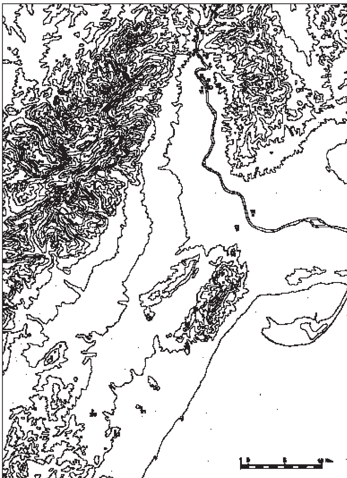
Figura 2. Mapa de distribució dels jaciments durant el segle VII a.n.E: 1.- Lo Toll; 2.- El Martorell; 3.- Aldovesta; 4.- Turó de Xalamera; 5.- Barranc de les Fonts; 6.- Barranc Fondo; 7.- Mas d'en Serra; 8.- Casa de l'Assistent; 9.- Plana de la Mora 1; 10.- Plana de la Mora 2; 11.- Els Tossals; 12.- Tossal Redó; 13.- El Figueralet; 14.- El Montsianell; 15.- La Ferradura; 16.- La Cogula; 17.- Sant Jaume; 18.- La Moleta del Remei; 19.- Castell d'Uldecona; 20.- Puig de la Misericòrdia; 21.- Puig de la Nau; 22.- La Tossa Alta; 23.- La Picossa.