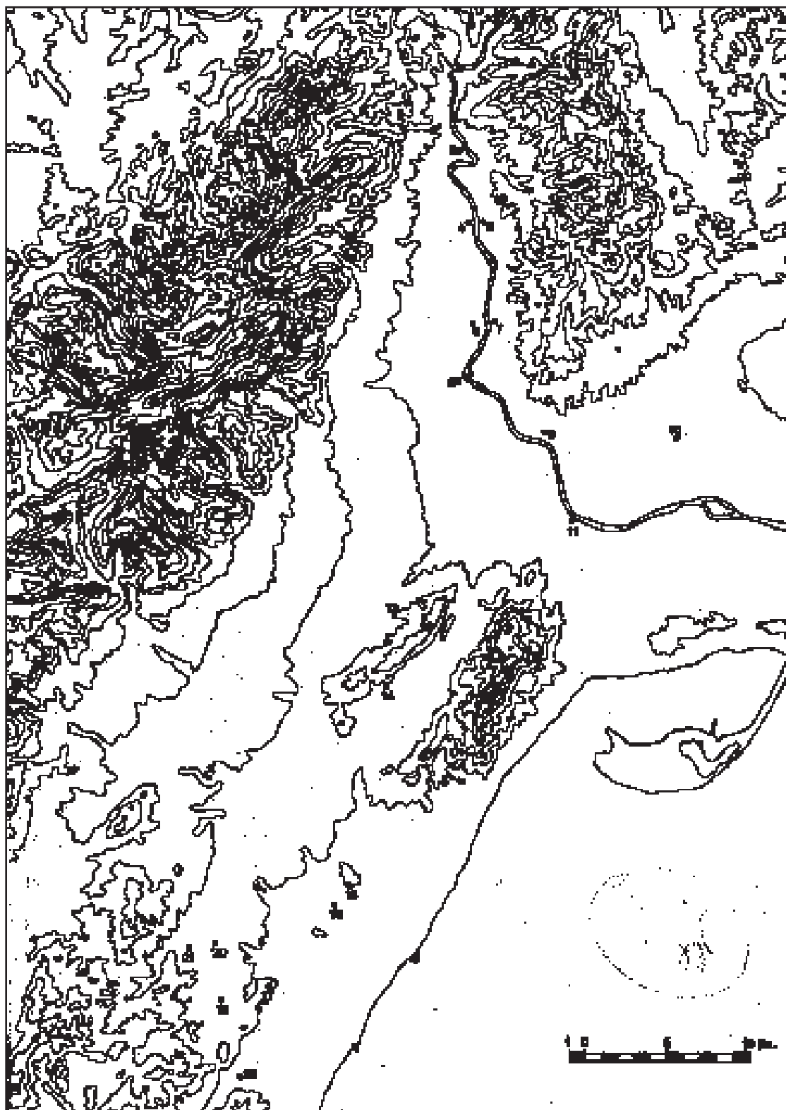
Figura 5. Mapa de distribució dels jaciments durant el segle I anE: 1.- Les Llomes; 2.- El Turó d'Audí; 3.- Els Arenalets; 4.- Les Valletes; 5.- Barrugat; 6.- Horta Baixa; 7.- Castell de Sant Joan (Dertosa); 8.- Pla de les Sitges; 9.- Masia Despatx; 10.- Mas de l'Antic; 11.- Castell d'Amposta; 12.- Vilallarga; 13.- Castell dels Moros; 14.- Mas de la Torre; 15.- Puig de la Misericòrdia; 16.- La Parreta; 17.- La Tossa Alta; 18.- El Pouaig; 19.- El Pou Neriol; 20.- La Picossa; 21.- Mas d'Aragó.