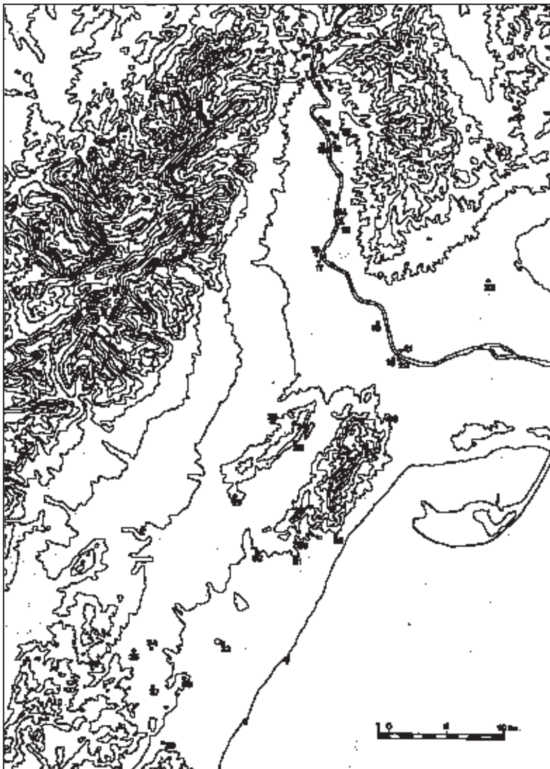
Figura 4. Mapa de distribució dels jaciments entre mitjans del segle V anE i inicis del segle II anE: 1.- El Turó d'Audí; 2.- El Martorell; 3.- Castellot de la Roca Roja; 4.- Mas de Xalamera; 5.- Les Trampes; 6.- La Torreta; 7.- Barranc de les Fonts; 8.- L'Assut; 9.- Km. 14; 10.- Les Planes; 11.- Punta de Plana de la Mora; 12.- Les Planetes; 13.- Les Valletes; 14.- Castell de Sant Joan; 15.- Hospital Verge de la Cinta; 16.- Barranc de Sant Antoni; 17.- Pla de les Sitges; 18.- La Carrova; 19.- Pla d'Empúries; 20.- Castell d'Amposta; 21.- Mas de Mussols; 22.- El Bordissal; 23.- Les Faixes Tancades de l'Antic; 24.- Castell dels Moros; 25.- Vilallarga; 26.- Les Esquarterades; 27.- Castell d'Uldecona; 28.- La Cogula; 29.- Punta de Benifallim; 30.- La Moleta del Remei; 31.- El Santo Cristo; 32.- Cota 154; 33.- Puig de la Nau; 34.- La Picossa; 35.- Mas d'Aragó; 36.- Castell de Cervera; 37.- Pou Neriol; 38.- La Tossa Alta; 39.- El Pouaig.