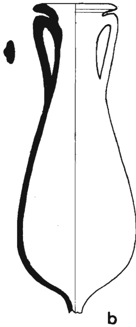
Fig. 1 Nules.