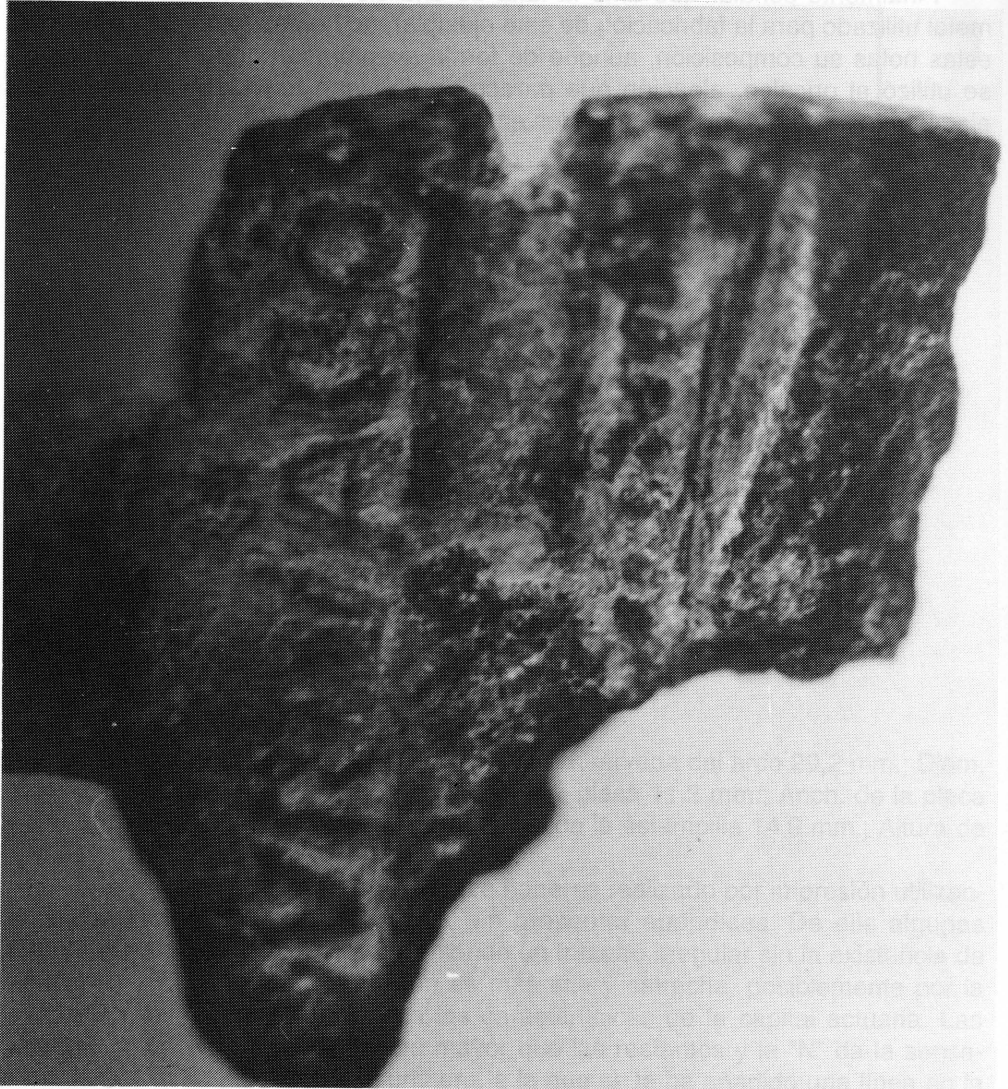
Detalle de la inscripción "DURNACOS"