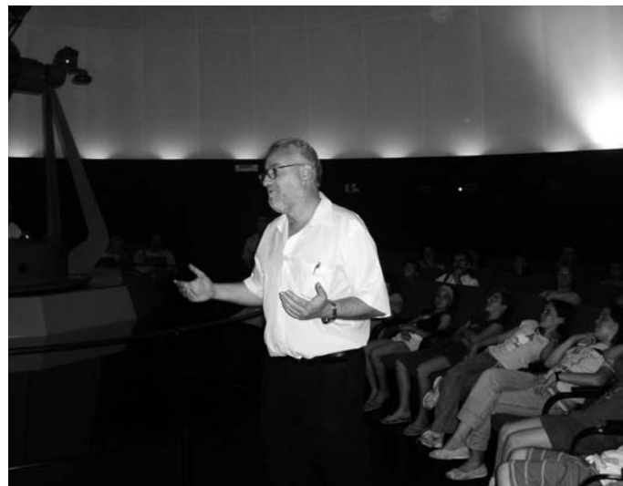
Festa al Planetari 2006

Castelló s'encreuen el meridià de Greenwich i el paral·lel quaranta. En la marjal, prop del camí La Plana hi ha un parc amb un monòlit que identifica el lloc d'encreuament. El Paral·lel quaranta fa referència a la posició de Castelló respecte a l'equador terrestre, mentre que el meridià de Greenwich és l'origen que arbitràriament va prendre l'IAU ( International Astronomical Union ) com a referència per a mesurar les longituds, en detriment de la proposta d'usar el meridià de París com es proposava des del món il·lustrat en el segle XVIII. Bàsicament es deu a la preponderància que va tindre durant eixa època la ciència desenvolupada a Anglaterra, ja que l'Observatori de Greenwich es trobe situat a Londres. Abans de la unificació de l'IAU cada país tènien el seu propi meridià d'origen per a les longituds, generalment en referència al seu principal observatori que sempre estava controlat per l'armada, i que solia situar-se dins de la capital administrativa.