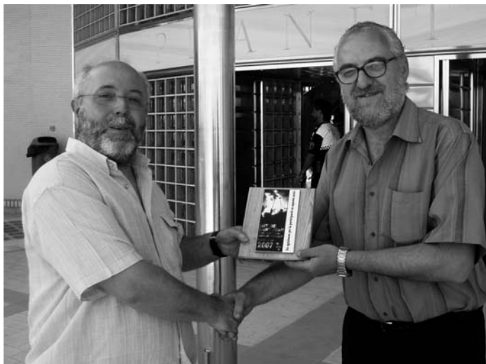
Sant Joan 2007