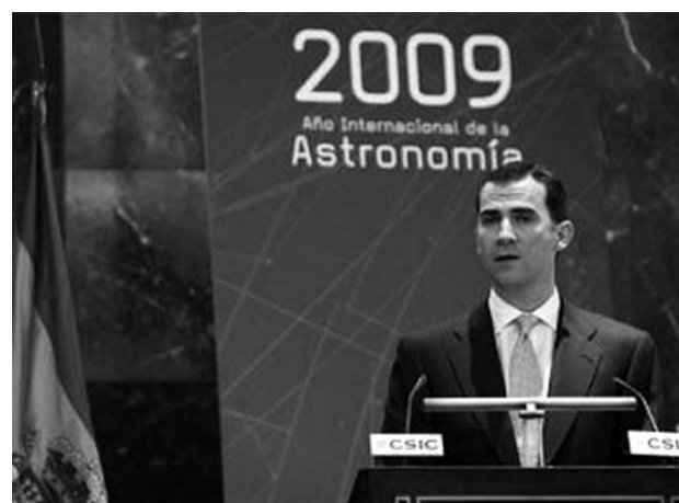
Príncip Felipe-acte d'inauguració Any Internacional de l'Astronomia