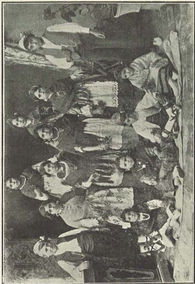
GRUPO DE JÓVENES DE SAN MATEO VESTIDOS A ESTILO DEL PAÍS - AÑO 1915