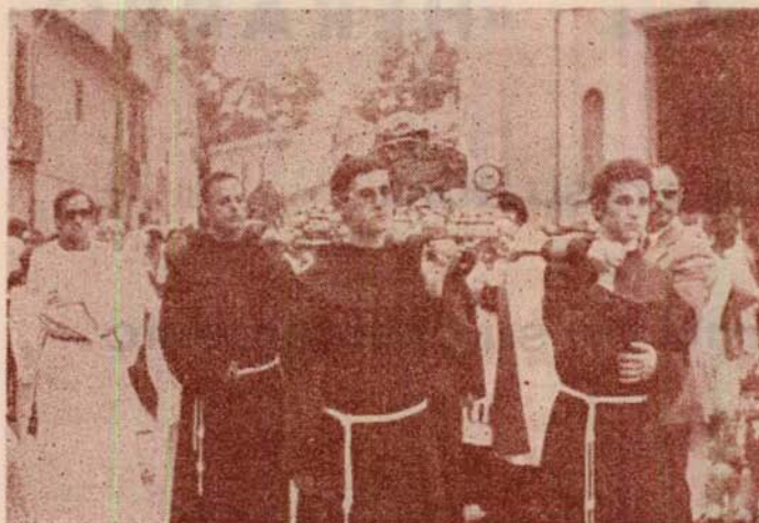
Religiosos Franciscanos llevando la reliquia del cráneo durante la procesión del día del Santo.

Por último, tuvo lugar una Misa Concelebrada, que presidió el Obispo de Segorbe-Castellón.