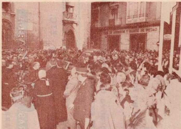
Momento de la llegada del cráneo de San Pascual, al Convento Franciscano de Valencia, con motivo del VIII Congreso Eucarístico nacional.

Tú, el más humilde, el más sencillo, el menos docto, eres presentado por la Iglesia como modelo de veneración a los sacratísimos misterios del Cuerpo y la Sangre del Señor.