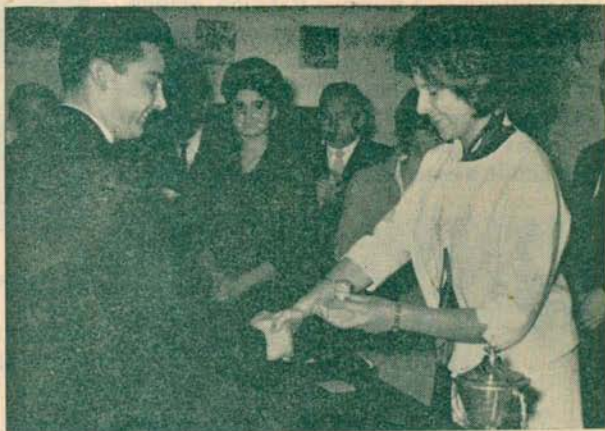
Entrega de premios a los ganadores del Concurso Fotográfico.

«Villarreal tuvo por Patronos desde los tiempos de su fundación en 1274, a San Bartolomé, a San Jaime, titular de su parroquia y también a Santa Ana. Esto era un obstáculo de cierta importancia para conseguir la declaración canónica de un nuevo Patrón, y las peticiones ele-