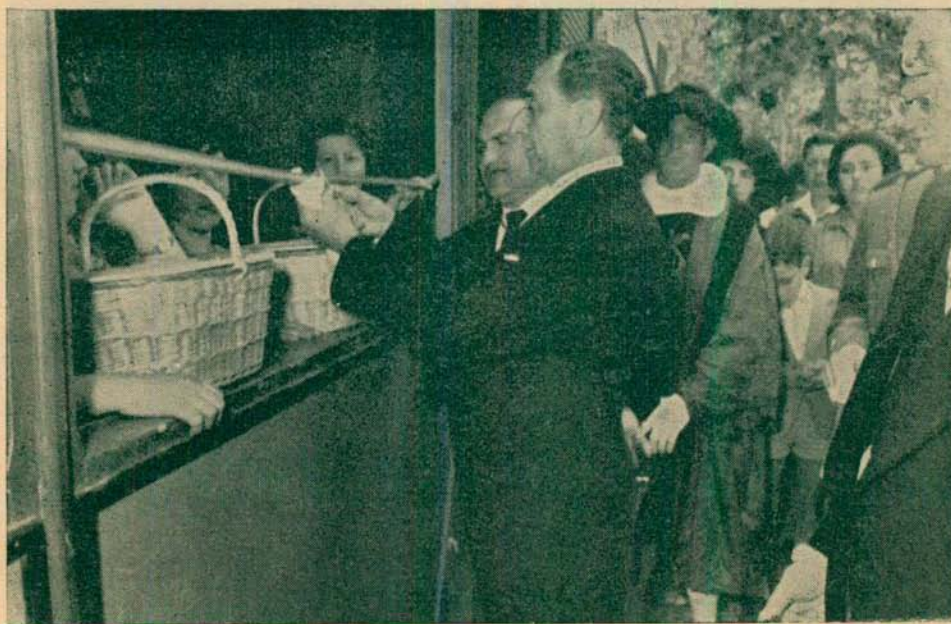
Tómbola Benéfica: El Alcalde de Castellón, cortando la otra cinta