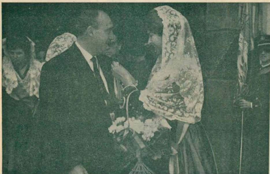
La Reina, en la Fiesta de la Flor, colocando un clavel en la solapa del Sr. Alcalde

Y para finalizar, vamos a dar la contabilidad de lo que fue la recaudación y los gastos: