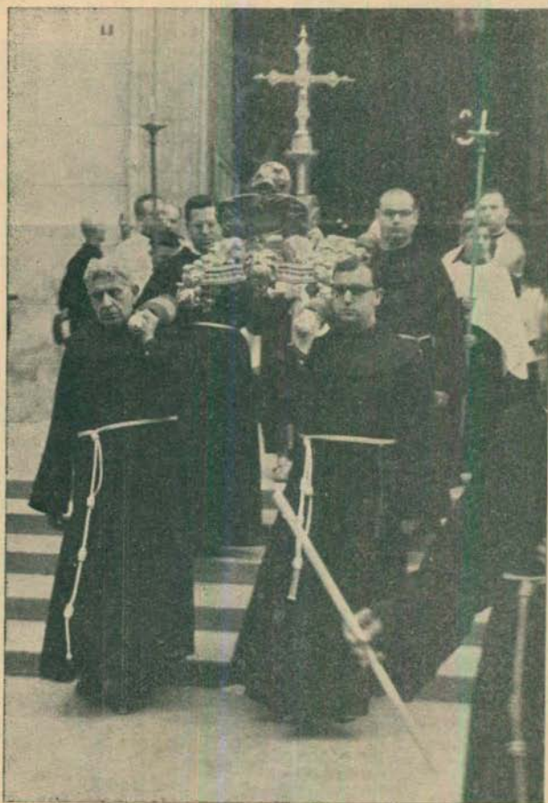
El Sacro Cráneo a la salida de la Arciprestal en la procesión.

Cuando terminada la procesión, era retornada la Reliquia de San Pascual a su sede, la Capilla interina en donde se ve-