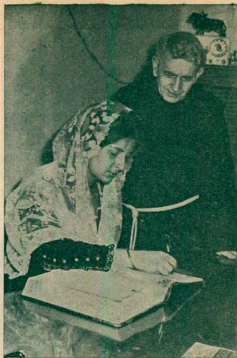
La Reina firmando en el Album de Honor

nuestras fiestas, para invitar a todos los villarrealeses presentes y ausentes, así como a todos nuestros hermanos de la Diócesis y provincia para que acudan a testimoniarle gratitud y devoción.»