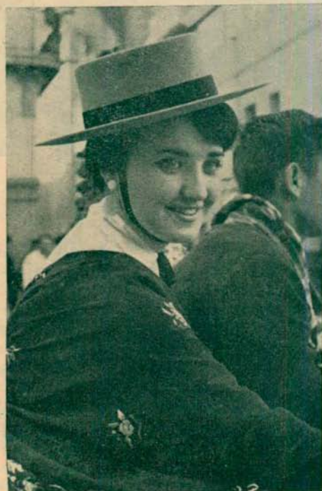
Una Dama de Honor, dispuesta para presidir las corridas de toros.

«Si siempre ha sido para mí una verdadera satisfacción saludar e invitar a todos a que participasen en las Fiestas que cada año dedicamos a nuestro Patrono, el lego franciscano San Pascual Baylón, ejemplo de humildad y de Amor de Dios, este año, que es el primero que se celebra la fiesta de San Pascual como Patrono de nuestra Diócesis Segorbe-Castellón, con más alegría acudo a este programa anunciador de