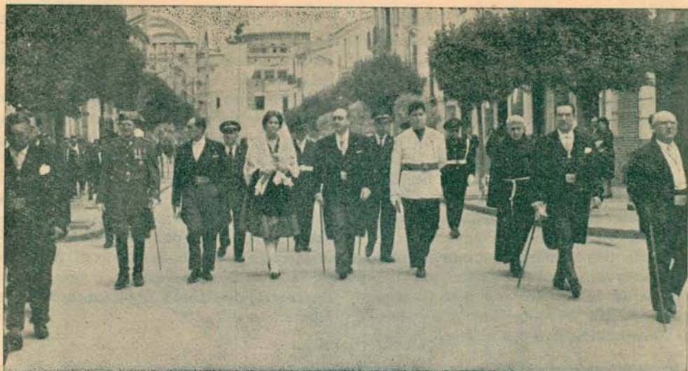
Las Autoridades dirigiéndose a la Tómbola Benéfica de San Pascual para su inauguración