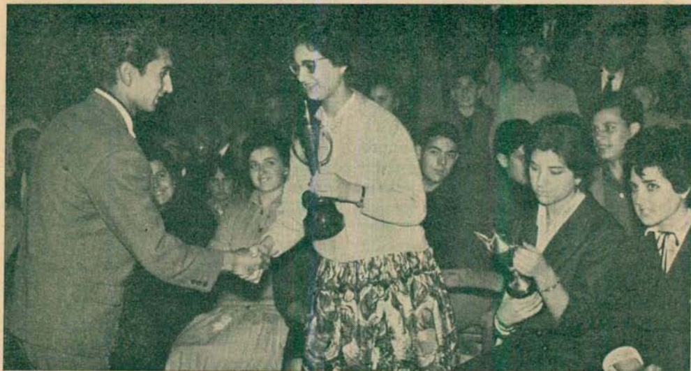
Entrega de trofeos a los vencedores del Concurso de Canto.