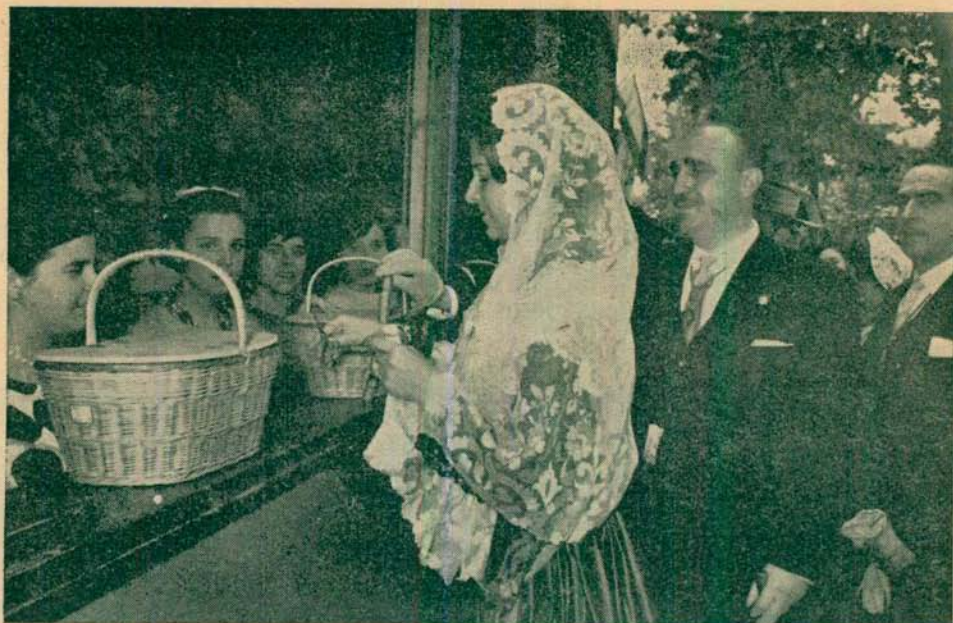
Tómbola Benéfica: La Reina cortando una de las cintas