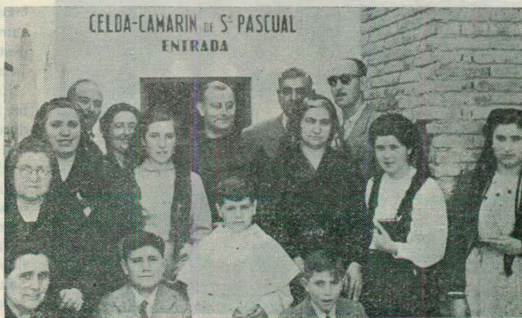
Después de recibir la Primera Comunión. Los peregrinos posan para la Revista