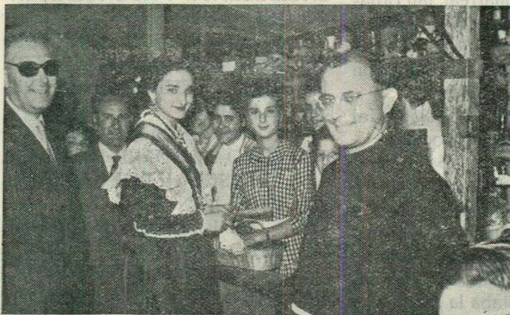
Momento en que la Reina de las Fiestas inaugura la Tómbola