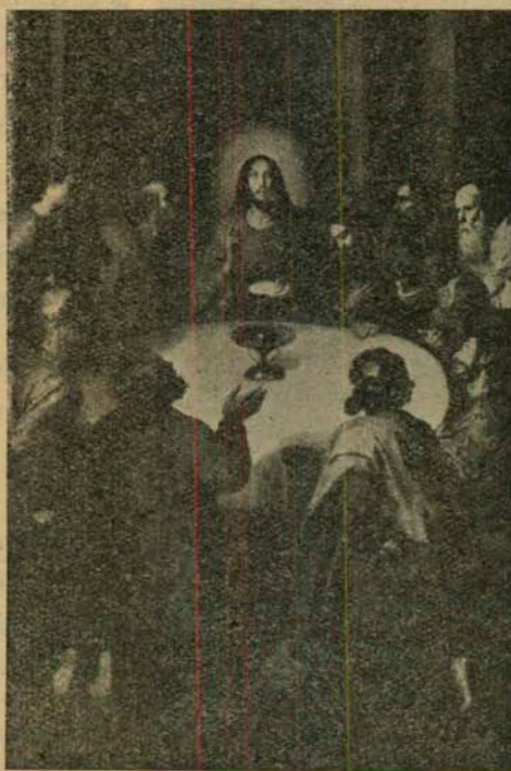
Valencia: Gigantesco lienzo en la Capilla de Corpus Christi, obra de Francisco Ribalta