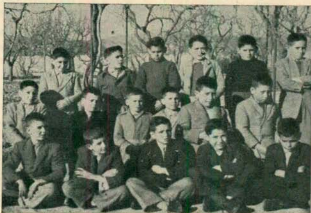
Grupo de niños que, siguiendo el llamamiento de Dios, ingresaron en nuestro Seminario Franciscano-Misionero de Balaguer (Lérida) en el curso 1951-1952

Si tú, niño, sientes vocación para el sacerdocio o para la vida misionera, debes exteriorizarla en todos los momentos para que los demás comprendan la fuerza de tu vocación