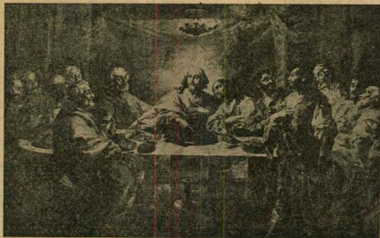
Lienzo gigantesco, en el R. Monasterio de Sta. Clara.

Interpretada por los antiguos pintores valencianos