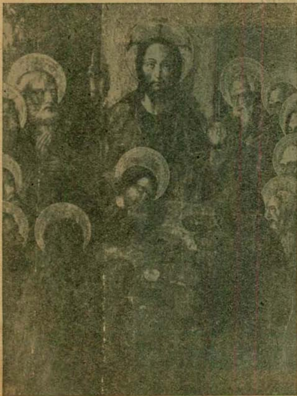
Bocairente: Tabla gótica (siglo XV).

Y pocas «Cenas» más, pintadas en aquel siglo XV, podemos hallar ya en nuestra provincia castellanense. He-