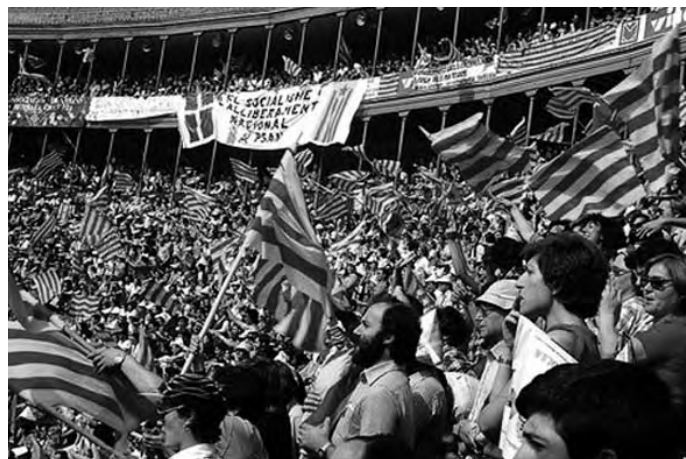
Acte polític a la plaça de toros de la ciutat de València al 1978

en defensa de de la llengua es va escampar per tot el País Valencià.