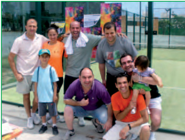
Pàdel Sant Joan 2011