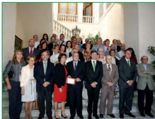
Valencià de l'Any