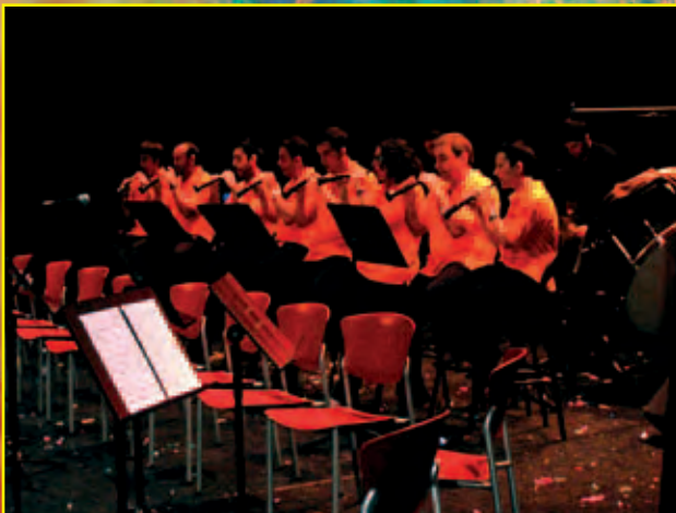
Concert per Sant Joan