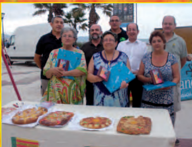
Concurs Coques de Sant Joan