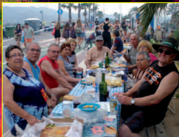
Nit de Sant Joan