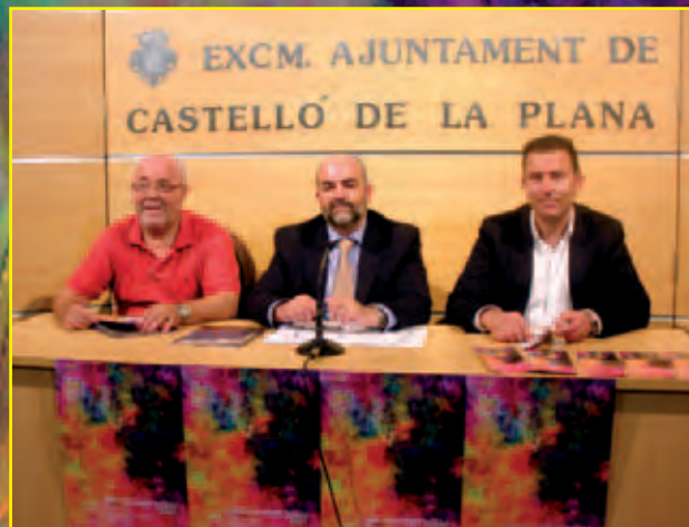
Roda de premsa