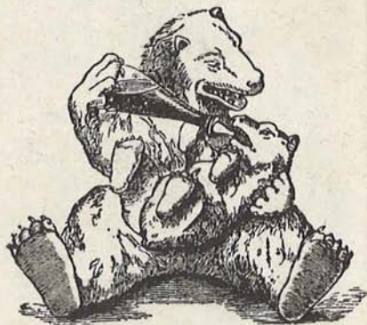
MARCA "EL OSO"