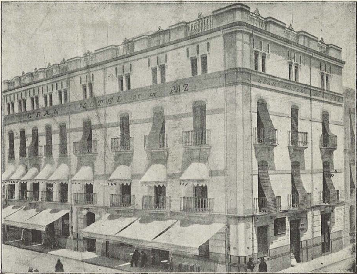
Castellón.-Magnífico edificio ocupado por el gran Hotel de "La Paz,,