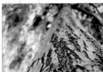
FINALISTA. «Complacido» es una de las imágenes finalistas.