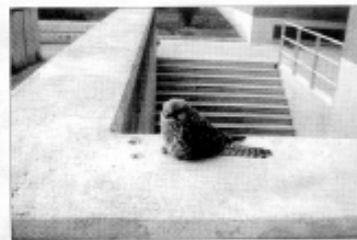
«PAJARO». «Una parada en el camino» es el título de esta imagen.