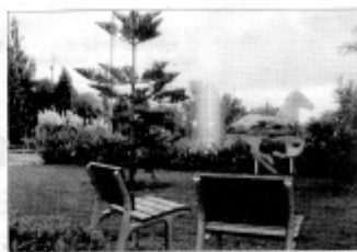
«SOLEDAD ARTIFICIAL». Esta fotografía está entre las finalistas.