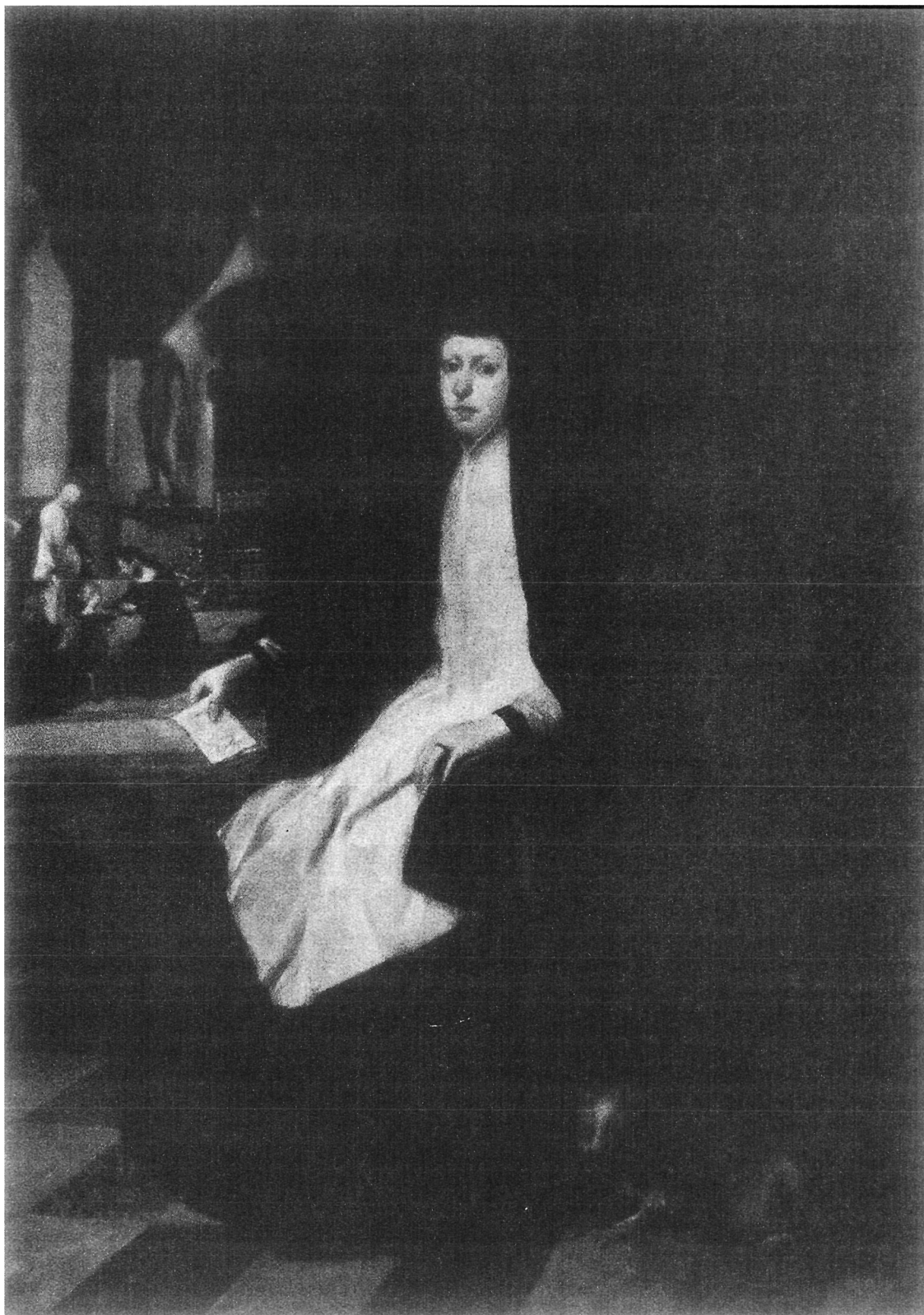
Figura 1: Mariana de Austria por Juan Bautista Martínez del Mazo National Gallery (Londres).