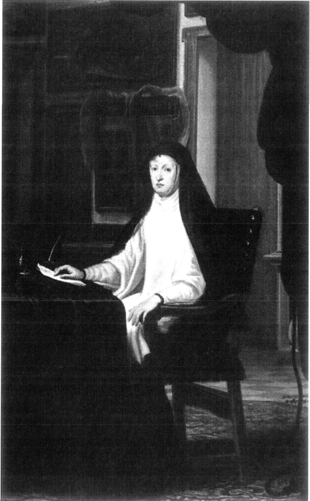
Figura 2: Doña Mariana de Austria, por Juan Carreño de Miranda. Museo del Prado (Madrid).