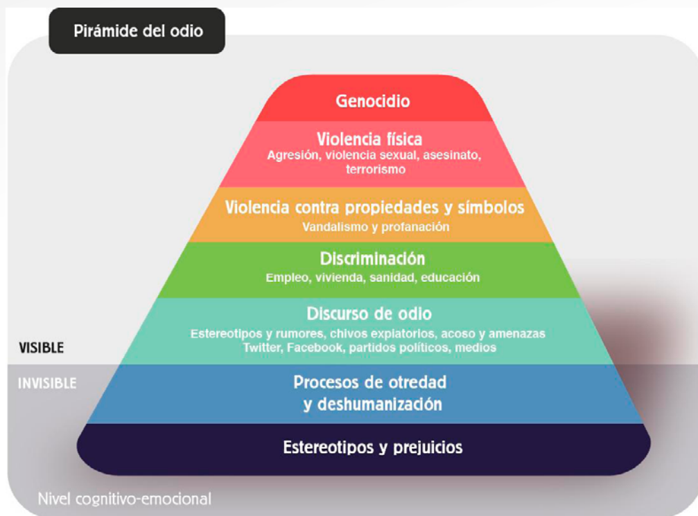
Imagen 1: Pirámide del odio.

musulmanas desde una perspectiva simbólica y estructural. Ambas imágenes nos muestran la importancia de detectar, transformar y erradicar todos los procesos de deshumanización, intolerancia y polarización.