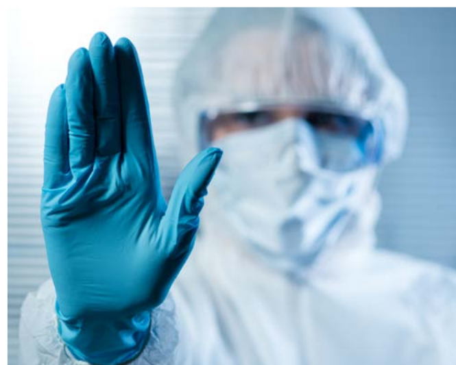
Se comunicaron setenta y cinco casos sospechosos de Ébola en España.

La política de la UE tiene por objeto proteger a los europeos de las graves amenazas para la salud con repercusiones más allá de las fronteras nacionales. Estos desafíos pueden abordarse de forma más eficaz mediante la cooperación a escala europea. En el marco del artículo 168 del Tratado de Lisboa y la Decisión 1082/2013/UE sobre las amenazas transfronterizas graves para la salud, la UE fomenta la coordinación entre países, que incluye el intercambio de mejores prácticas.