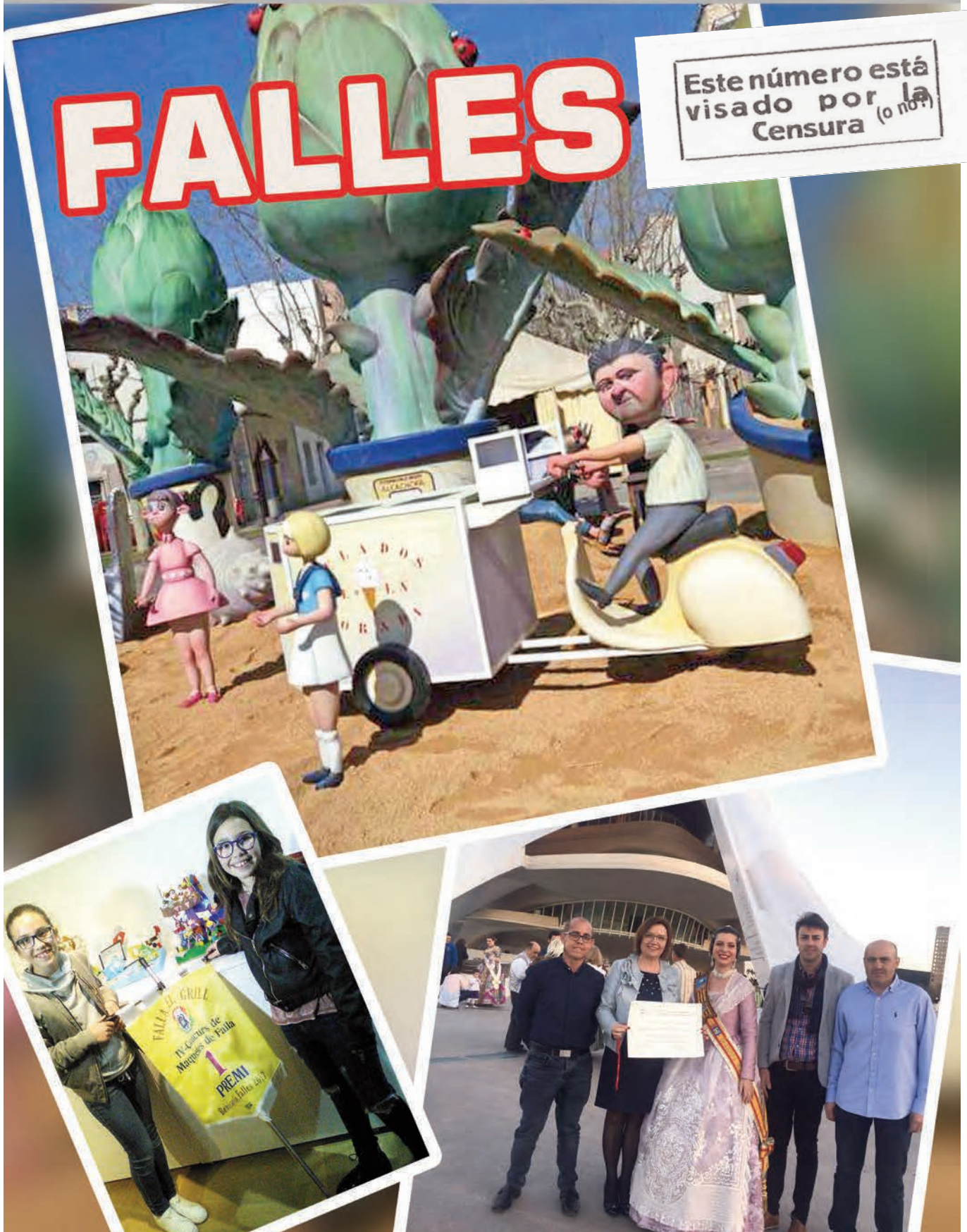
La Falla Mercat Vell (gran) i El Caduf (infantil) guanyadores del 2017

Este número está visado por la Censura (o no)