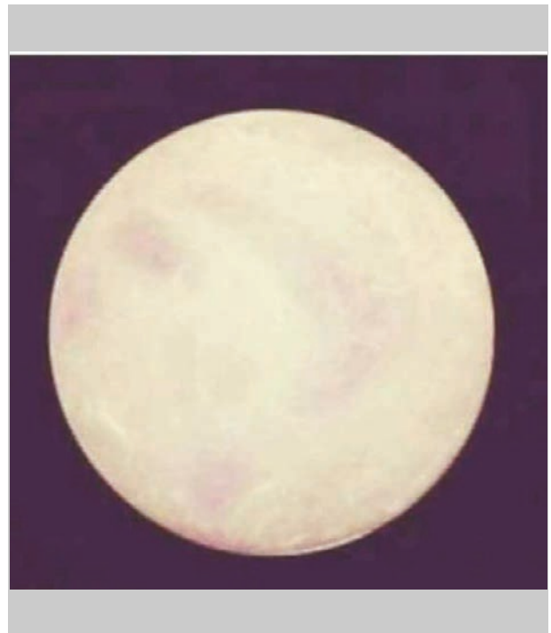
Luna hiena 🐾

seguidors ens han enviat: la "luna hiena", i la "mortadela". Quina de les dos resulta més espectacular? Sabreu distingir-les, no? O haurem de posar el títol a sota? Bé, ja havíem anunciat que aquesta setmana (tampoc) no anàvem massa fins, així que fins ací hem arribat. La setmana que ve més... si no passa res!