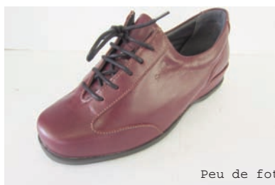
Peu de foto

Per descomptat, cal admetre que la marca "Benicarlo" ven allà on va. O això és el que deu pensar més d'una empresa quan utilitza el nostre topònim per promocionar un model d'una marca.