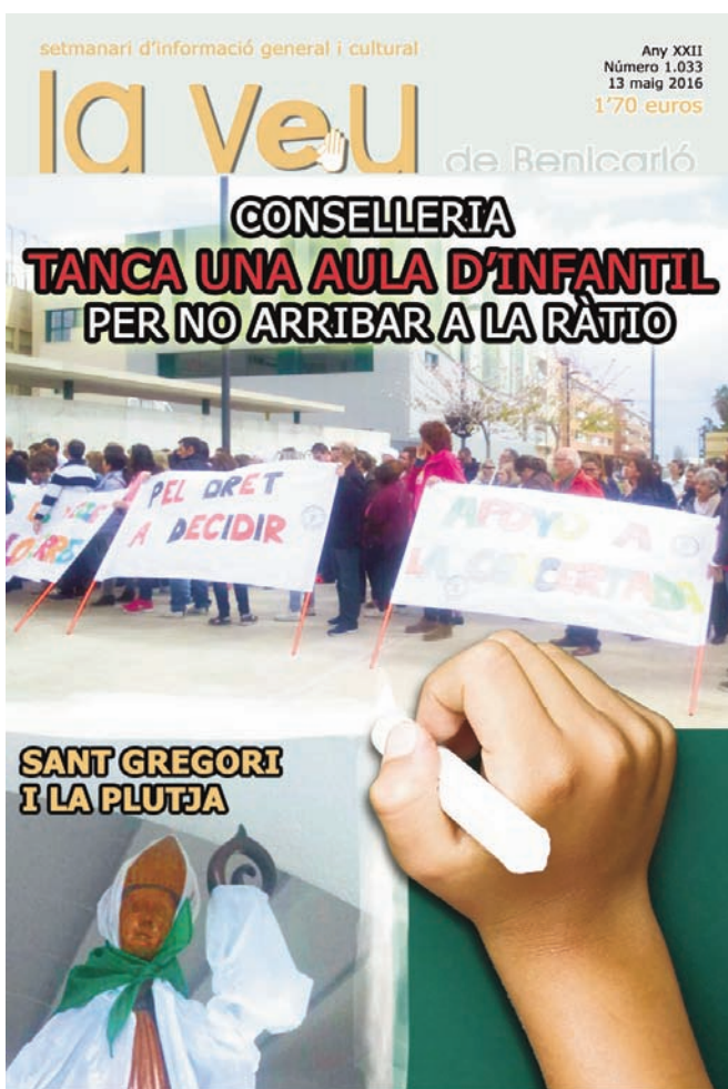
LLIBRES: "La passejadora de gossos"