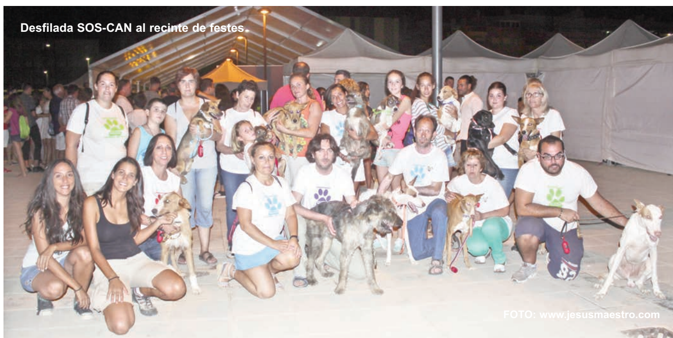
Desfilada SOS-CAN al recinte de festes.

ciutat. La gran concentració d'actes va fer que veïns i visitants de poblacions properes ompliren els carrers amb ganes de participar de forma activa en els actes programats per a la jornada. Així, al matí les activitats esportives amb campionats de tennis, motocròs, bàsquet o pilota valenciana. A la tarda, els més joves obrien els actes amb la Ruta de Germanor de les penyes, que va recórrer diferents carrers de la ciutat acompanyats d'una xaranga. Els xiquets van tenir per la seua banda l'oportunitat de participar en la festa infantil que es va organitzar per a ells. Més tard la Colla de Gegants i Cabuts treia al carrer als seus personatges per a realitzar una colorida cercavila en col·laboració amb l'Associació Espanyola contra el càncer. El concert extraordinari de Festes de la Coral Polifónica Benicarlanda obria, per la seua banda, l'apartat musical en la vespra de la festivitat del patró de la ciutat. En aquesta ocasió, la música afroamericana centrava el repertori. La Banda de Música