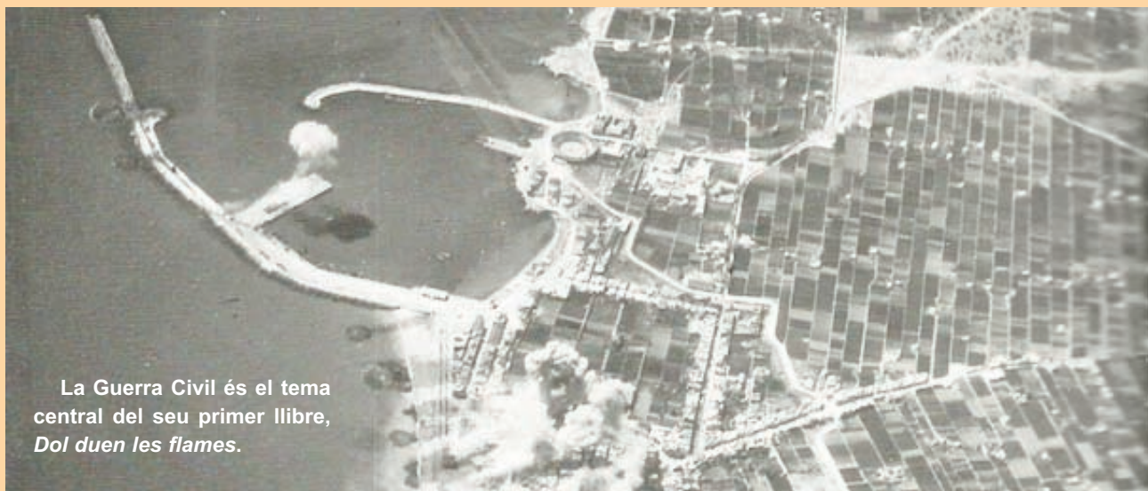
La Guerra Civil és el tema central del seu primer llibre, Dol duen les flames .

Aprofitant el desé aniversari del seu traspàs, seria un bon moment per a que alguna editorial professional o alguna institució valenciana, s'ocuparà de fer una bona edició de la seua obra poètica completa.