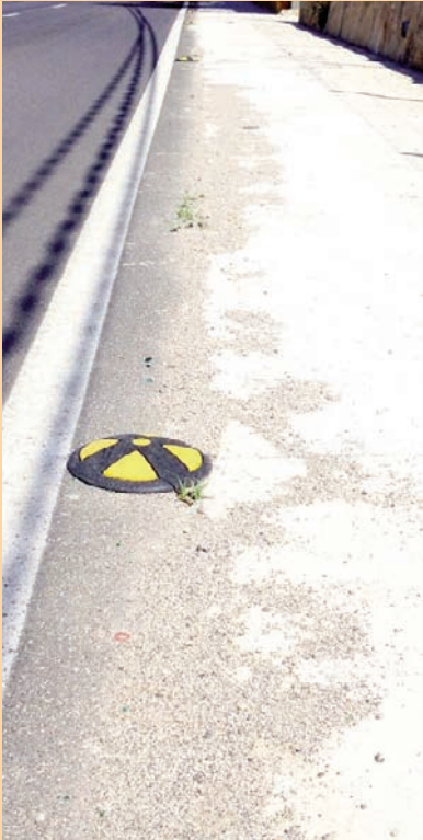
Camí de l'ermita