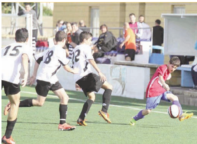
Foto arxiu juvenil passada temporada.

Pel que fa al CD Benicarló, aquest dissabte 30, a les 20.00 hores, en el Municipal Àngel Alonso, disputarà el seu últim partit de pretemporada, davant el Sant Jordi que milita en la Primera Regional.