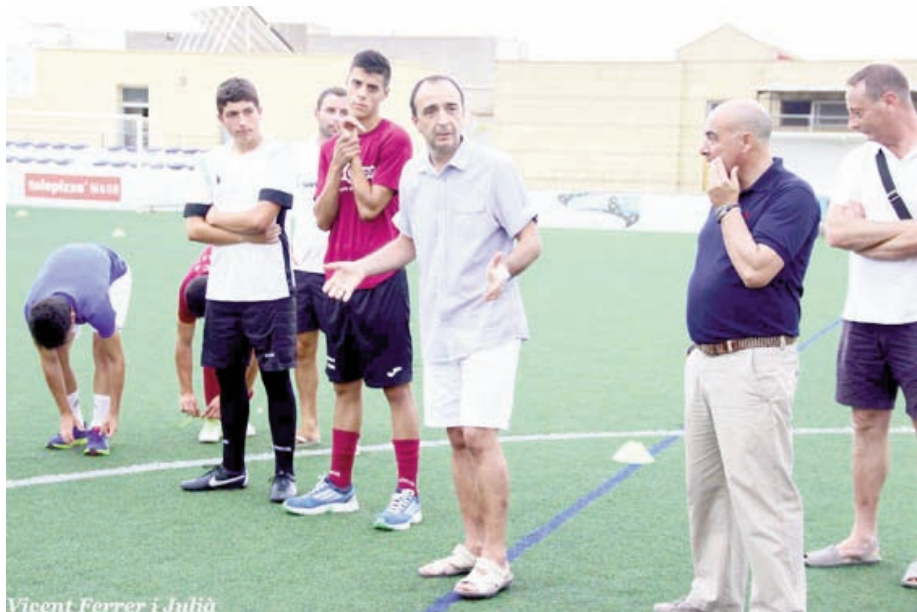
Vicent Ferrer i Julià