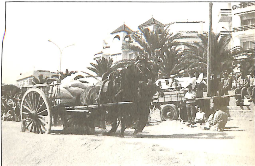
Foto del Concurso de Tiro y Arrastre.