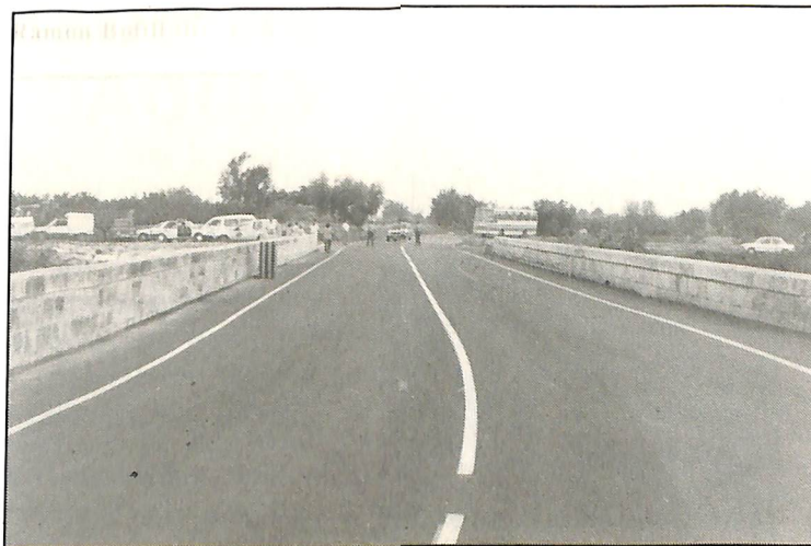
Vista del nuevo puente.

Este puente se ha construido sobre uno existente ya que databa de la época de Carlos III y el cual era de pequeñas dimensiones, permitiendo sólo el paso de pequeños vehículos.