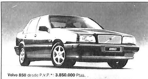
Volvo 850 desde P.V.P.* 3.850.000 Ptas.