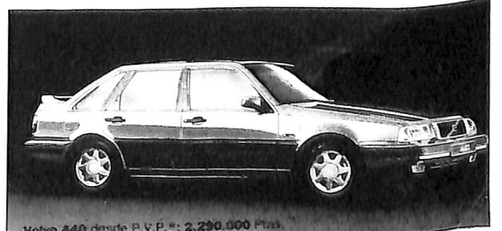
Volvo 440 desde P.V.P.* 2.290.000 Ptas.