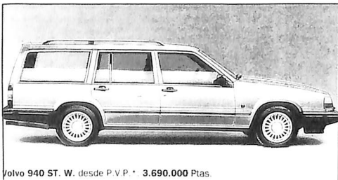
Volvo 940 ST. W. desde P.V.P.* 3.690.000 Ptas.