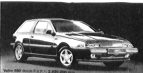
Volvo 480 desde P.V.P.* 2.890.000 Ptas.