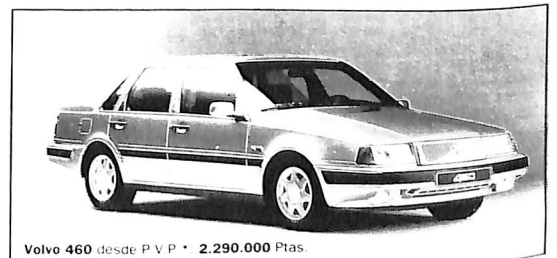
Volvo 460 desde P.V.P.* 2.290.000 Ptas.