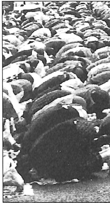
CADA VEZ SOMOS MÁS A LOS QUE NOS DAN...