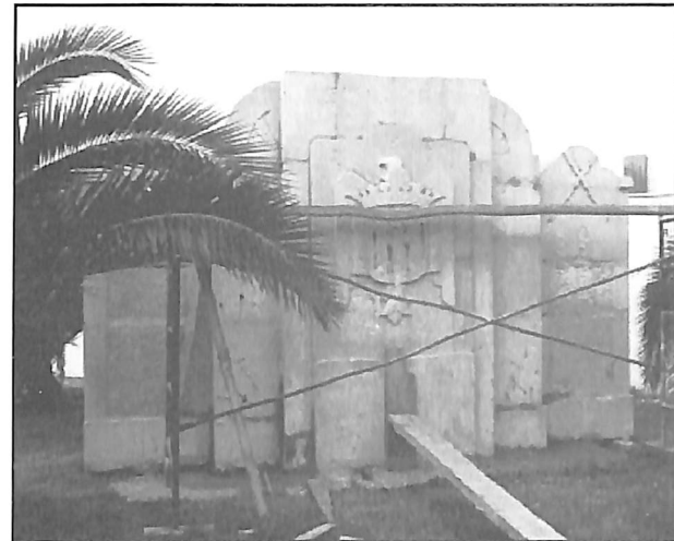
Los numerosísimos benicarlondos que estos días visitarán el campasanto podrán contemplar el Monumento a los Caidos.