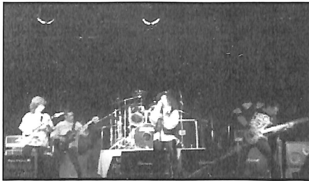
El grupo Calibre interviene en la gran fiesta de la Ser Maestrat