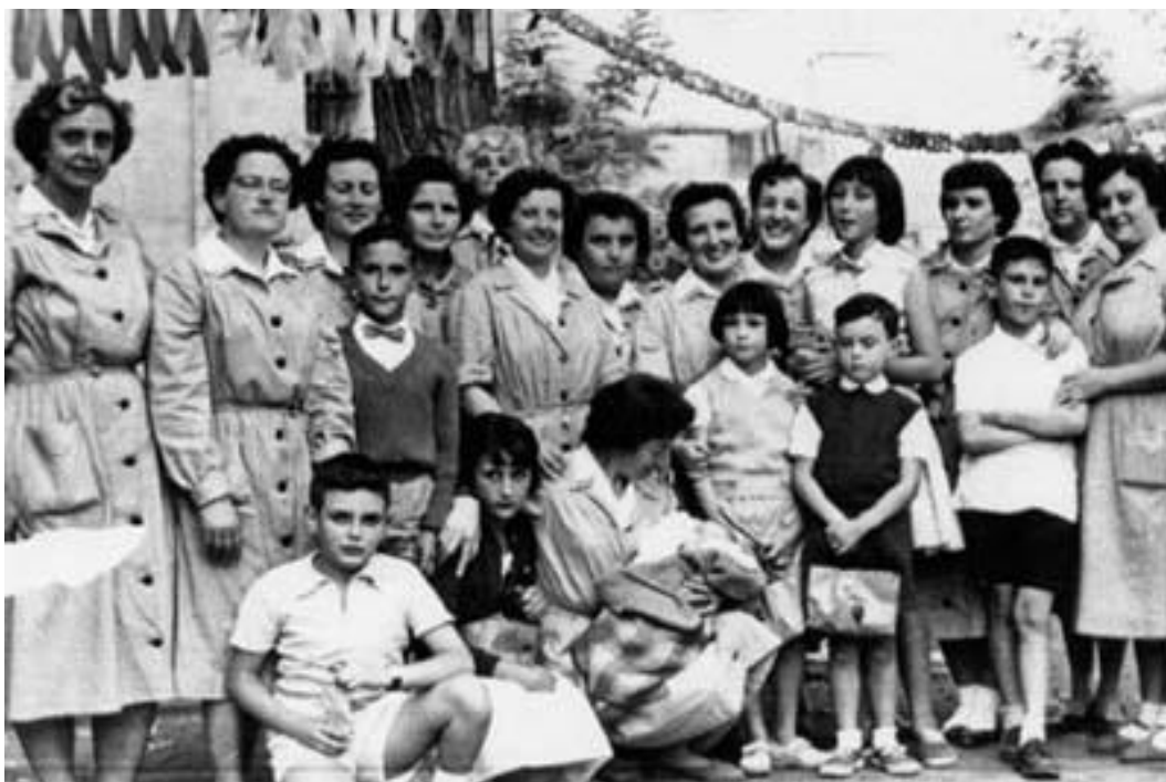
Remedios en la Cárcel de Alcalá de Henares