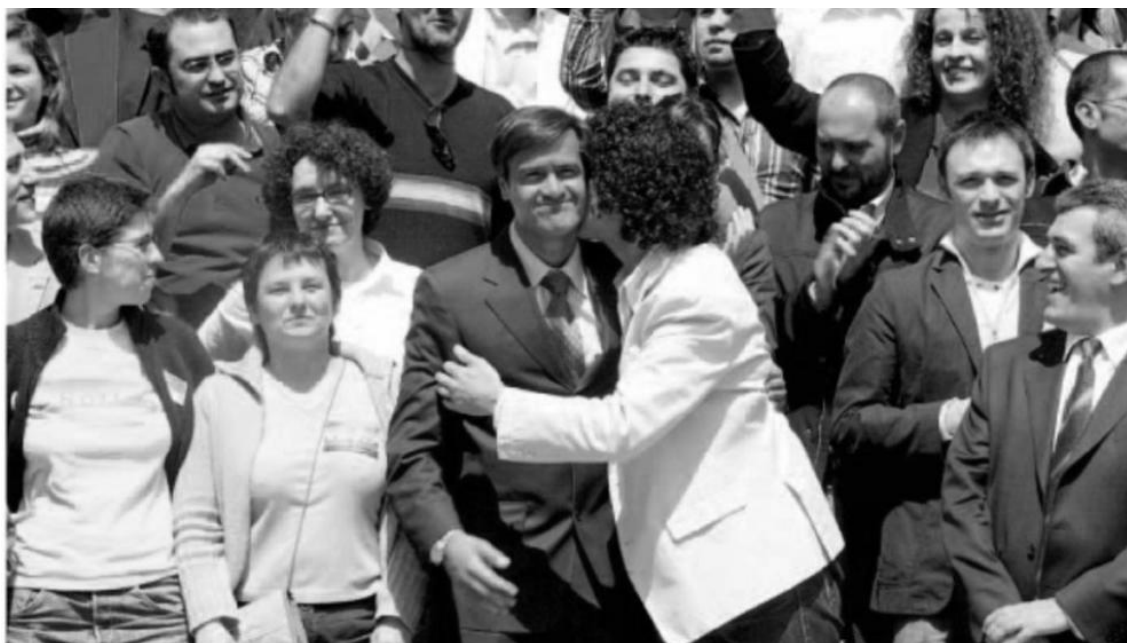
Aprobación de la ley del matrimonio gay, Madrid, 2005.