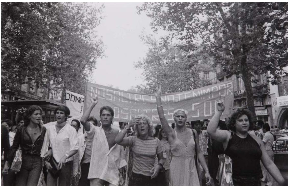
Manifestación Gay, Barcelona, 1977 (Colita)

Las travestis –completa Platero en una entrevista realizada con motivo del libro que edita Intersecciones: cuerpos y sexualidades en la encrucijada (2012)– representan una imagen incómoda para el movimiento gay que en ese momento está diciendo "nosotros somos los homosexuales respetables , que quieren hacer alianzas con la izquierda, que quieren hacer alianzas con el feminismo y conseguir derechos..." Hay una imagen muy buena de Colita en la que se ve claramente 13 (Platero, 2013: 45-46).