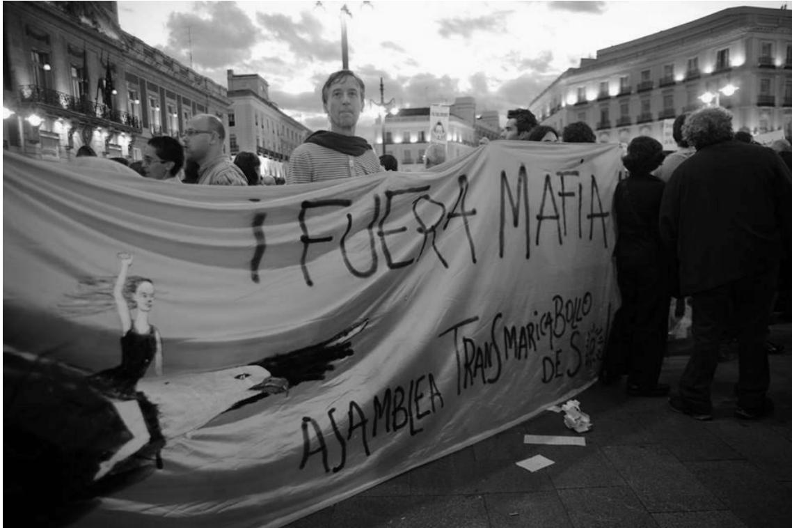
Asamblea Transmaricabollo de Sol, Madrid, 2015

Por otro lado, y aunque desde 2007 se añade la letra " a las siglas de la FELGTB, no será hasta 2016 que empiece a visibilizarse realmente el movimiento bisexual en España 35 al definirse desde la Federación como el Año de la Visibilidad Bisexual en la Diversidad 36 . Como ya indicamos al principio del relato, a lo largo de la historia del movimiento LGTB en España la B, que representa a las personas bisexuales, no ha recibido la misma atención que el resto de siglas que conforman este colectivo 37 .