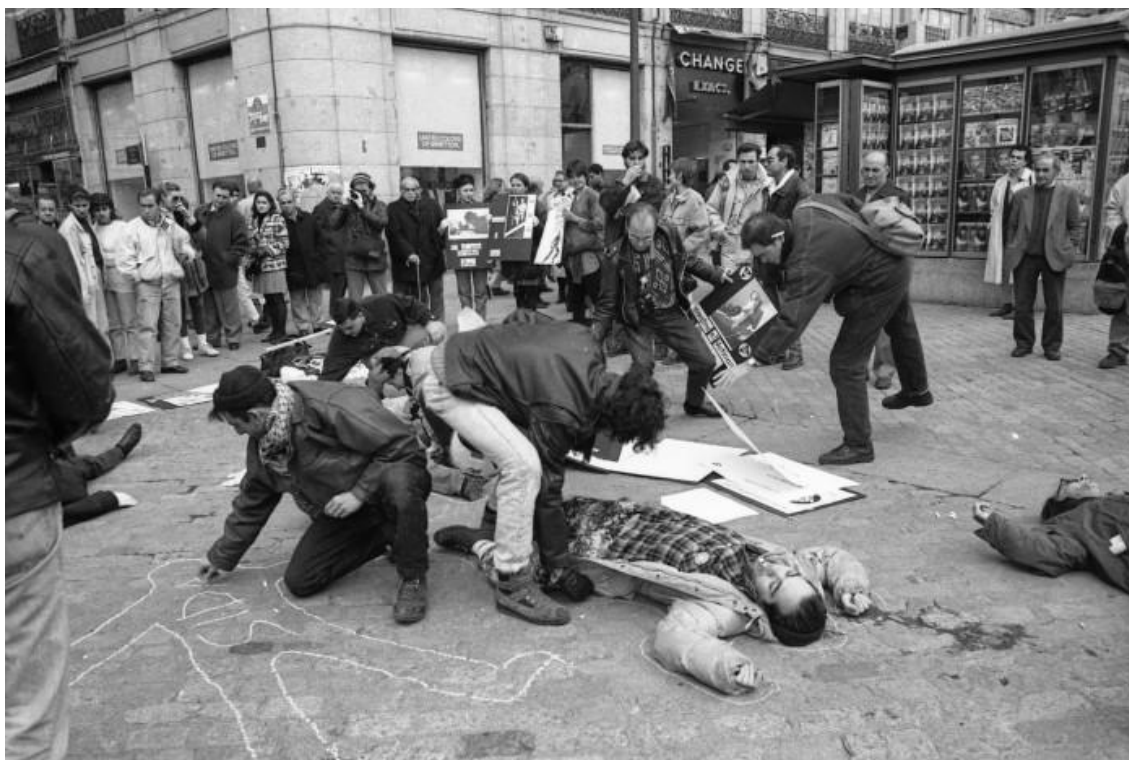
Intervención de La Radical Gai y LSD, Día de la lucha contra el sida, Madrid, 1996.