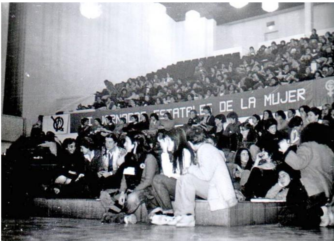
II Jornadas Estatales de la Mujer, Granada, 1979

Las Jornadas de Granada de 1979 constituyen la primera gran ruptura del movimiento feminista que culmina con la polarización ya existente entre las dobles militantes y las independientes, también llamadas autónomas o radicales 17 . La división de posturas en torno a la militancia y la política 18 se saldó con la escisión del movimiento y la salida de las radicales, que empezaron a organizarse de forma independiente (Moreno, 2012: 91; Gil, 2011: 145). Estas jornadas marcan además el fin de un etapa de hegemonía de la Coordinadora Estatal de Organizaciones Feministas, que en los ochenta dejará de ostentar la representación del conjunto de fuerzas.