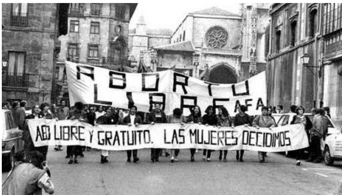
Manifestación a favor del aborto, Oviedo, 1985.

A raíz de estos encuentros, en enero de 1981, se constituye el cflm, al que seguirán otros muchos repartidos por todo el territorio español, agrupados todos ellos en la Coordinadora Estatal de Organizaciones Feministas (Osborne, 2007). Ese mismo año se celebra también el Encuentro Estatal sobre el Derecho al Aborto, en el que se dio un importantísimo paso en las relaciones entre lesbianismo y feminismo al acordar que la reivindicación del aborto debía realizarse en el marco de una lucha más amplia contra el modelo sexual dominante (Gil, 2011: 138). Las movilizaciones en torno al aborto aglutinaron a diferentes organizaciones del movimiento y permitieron una progresiva recomposición de fuerzas que consiguió mantener la presencia pública de las feministas (Augustín, 2003: 313; Trujillo, 2009: 165).