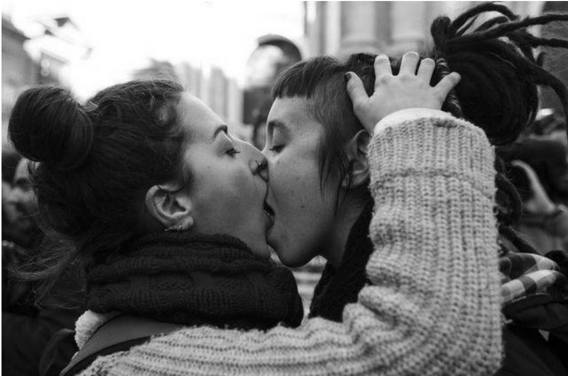
Imagen de una besada de protesta, Málaga, 2014.