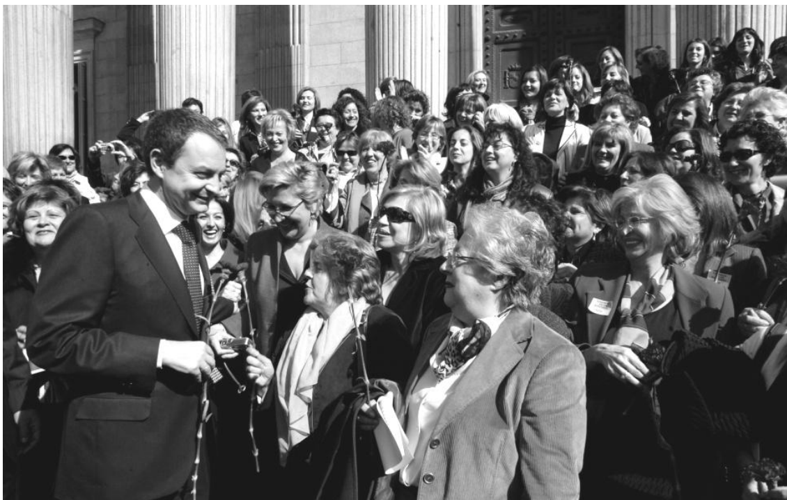
Aprobación de la ley de igualdad, Madrid, 2007

Las jornadas estatales feministas celebradas en Córdoba en el año 2000 sorprenderán a muchas al reunir a más de 3.000 mujeres, sobre todo jóvenes. Estos encuentros presentarán un amplio movimiento de mujeres, revitalizado en la diversidad y heterogeneidad de sus grupos. La Marcha Mundial de Mujeres que se organizó ese año contribuirá sin duda a revitalizar la movilización, al permitir el tráfico de ideas y experiencias entre feministas de distintos países (Martínez González 2008: 14-15).