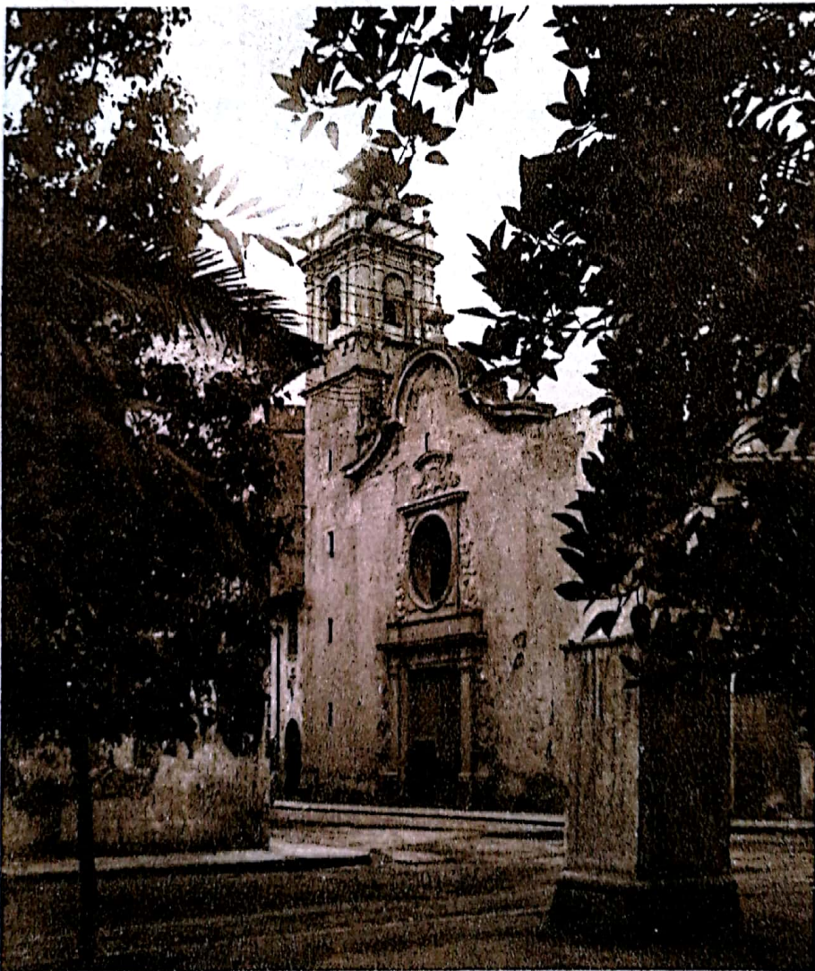
Iglesia de la Sangre

La Magdalena , al NE. de la ciudad, a unos 7 kilómetros, es una rústica y evocadora ermita sobre un tormo que fué castro ibérico y donde todavía quedan vestigios árabes y medievales; ofrece exuberantes y amplias perspectivas ricas de color y llenas de emoción. Emplazóse aquí el primitivo Castellón. La ermita solo se abre el día de la