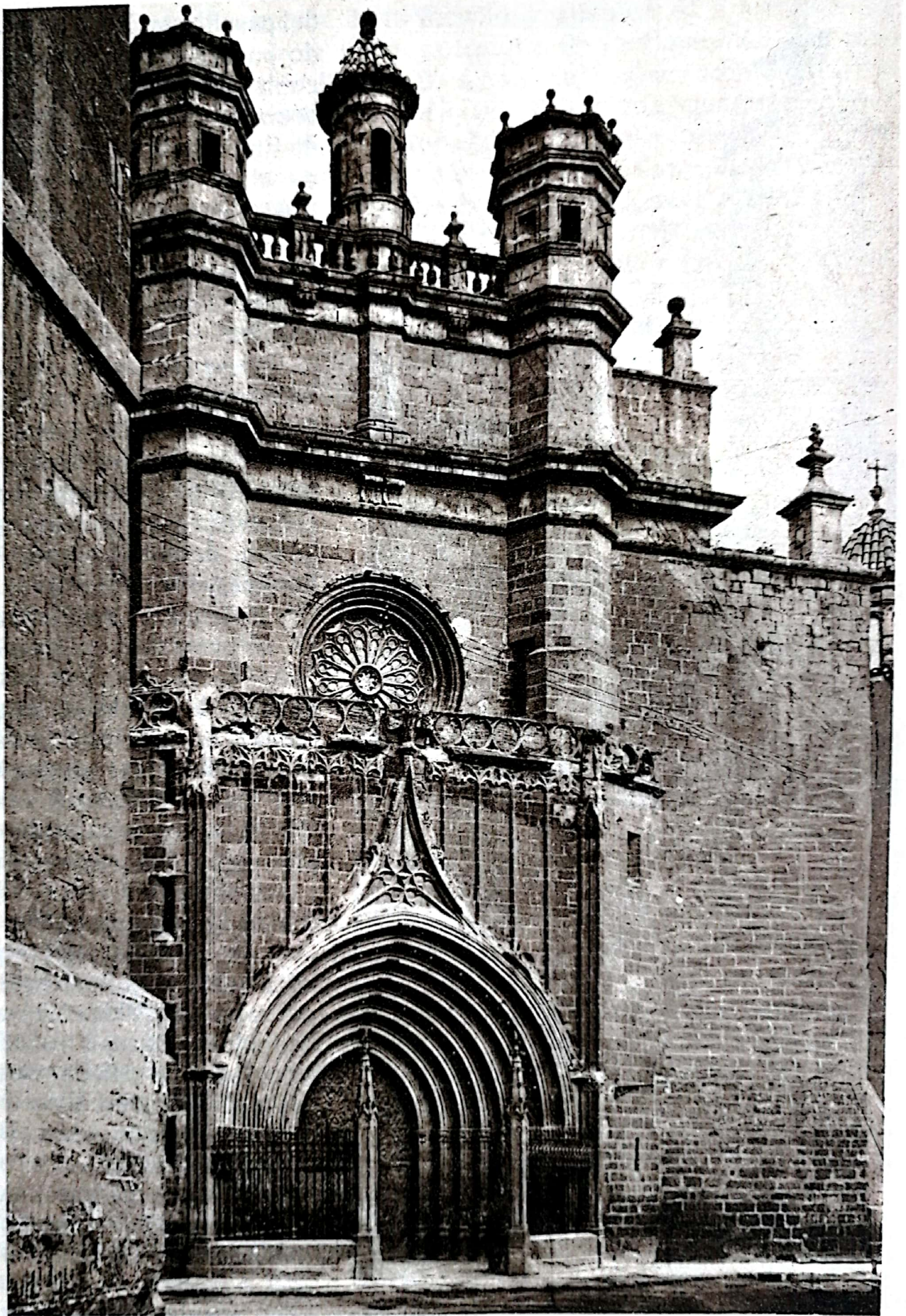
Fachada de Santa María