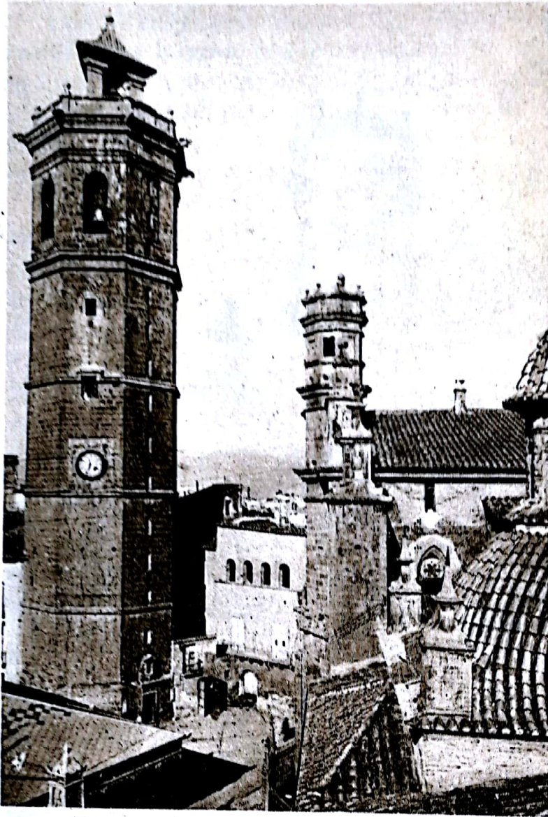
Torre de las campanas e iglesia de Santa María