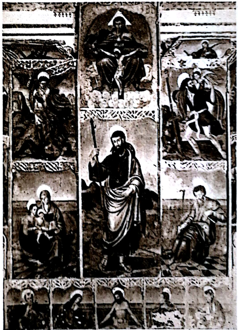
Retablo de la ermita de San Jaime

Un paseo por la huerta pródiga y bella puede hermanarse con la visita a las ermitas de San José, San Isidro, San Roque de Canet y Fadrell, lugares de devoción, algunos con reliquias medievales. La ermita de San Jaime, antigua iglesia de la Encomienda de Fadrell, de la Orden de Calatrava primero y de Santiago después, conserva una pila bautismal románica, un re-