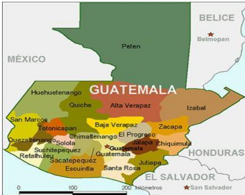
Figura 1. Mapa de Guatemala.

precolombina. En esta línea no es de extrañar que este sea un país rico en diversidad, en el cual la población indígena conforma el 40% de la población, conservando 22 idiomas de origen maya, aunque la lengua oficial en todo el país sea el español.