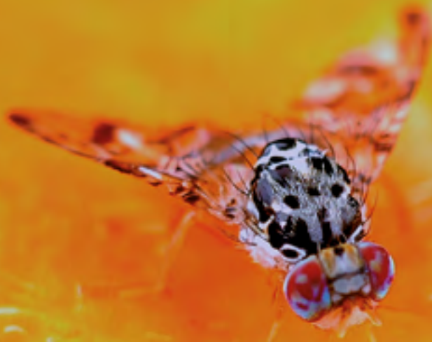
Adulto de Ceratitís capitata .