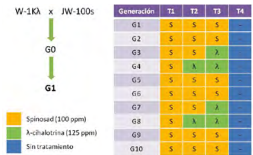
Figura 3. Simulación en laboratorio de cuatro estrategias (T1-T4) de manejo de la resistencia de Ceratitis capitata .

u otros insecticidas con los que presente resistencia cruzada, como fosmet (Couso-Ferrer y col., 2011), se utilizaran sin una estrategia apropiada de manejo. También se han diseñado marcadores para la detección de las mutaciones asociadas a la resistencia a spinosad y, hasta la fecha, ninguna de ellas ha sido hallada en las poblaciones de campo analizadas (Ureña y col., manuscrito enviado para su publicación).