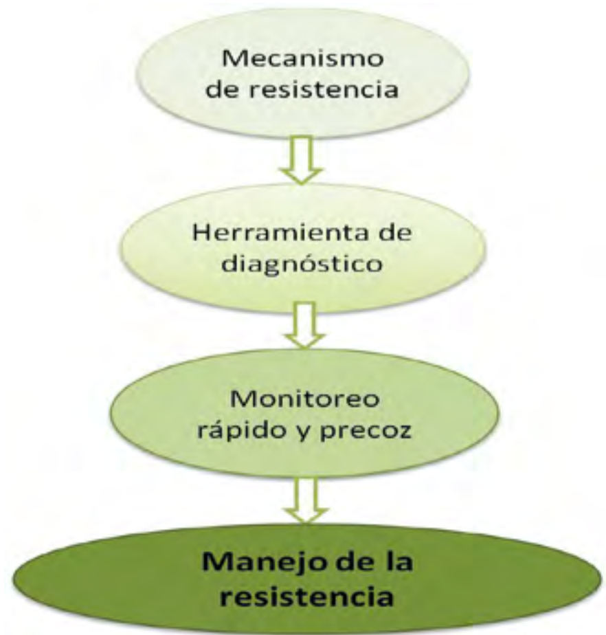
Figura 1. Esquema para el manejo de la resistencia de Ceratitis capitata a insecticidas.

La aparición de resistencia en poblaciones de campo se detectó por primera vez en España frente a malatión en 2004-2005 (Magaña y col., 2007), asociada al uso intensivo que se hacía de este producto, y poste-