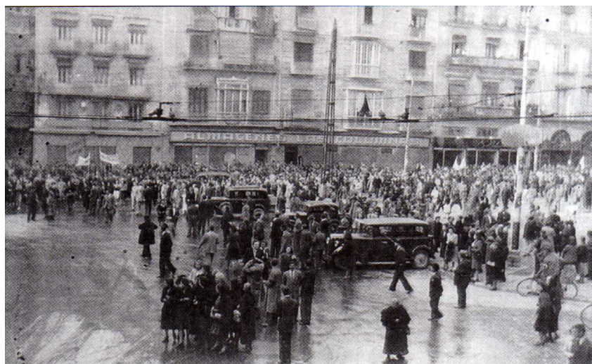
Figura 5: Aspecto de la multitudinaria manifestación celebrada en Valencia el 3 de diciembre de 1945 para celebrar la liberación de D. Javier de Borbón Parma del campo nazi de Dachau y que se desarrolló en un clima de gran tensión. En la de Pamplona se produjo un enfrentamiento armado entre carlistas y policías.

adoptadas por el Consejo de la Comunidad celebrado los días 9, 10 y 11 de marzo de 1951, pero sobre todo en un importante documento fechado en 1952 que, bajo el título «Palabras del Carlismo», describe, desde una perspectiva puramente teórica y académica, «lo que es y afirma la Tradición de las Españas en 1952», como reza el subtítulo. Se trata de un documento de 50 páginas mecanografiadas que realiza un sistemático repaso a los fundamentos ideológicos del carlismo, comparándolo con las tendencias filosóficas y políticas más relevantes de la época. Ya la referencia a «las Españas» y no a España, en singular, indica el grado de ortodoxia de este ensayo, que insiste, a lo largo de sus seis capítulos, en distanciarse y condenar al mismo tiempo los sistemas de democracia formal, los totalitarios –fascistas o estalinistas– y los liberales, aunque subraya de forma especial su rechazo a «movimientos políticos totalitarios del tipo Falange Española y de las JONS». 13