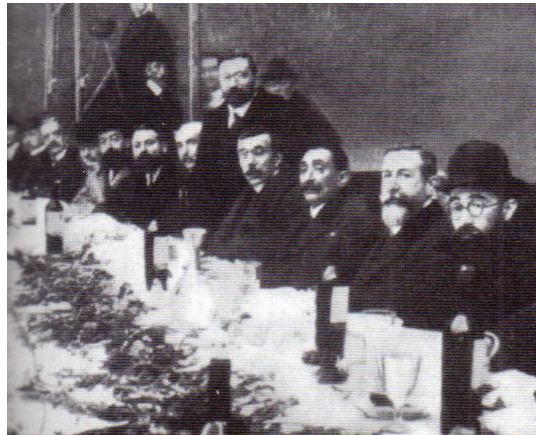
Figura 2: Reunión de carlistas con los diputados de su formación. En el centro, de pie, Vázquez de Mella; en primer plano, con sombrero, el escritor Valle Inclán. 12 de enero de 1911.

El problema que el mismo Vázquez de Mella observa es que ve difícilmente realizable esta forma de democracia a niveles superiores al municipio y, además, la delegación del ejercicio del poder que supone la representación política a través de los partidos o el sufragio universal en esta época supone la manipulación de un cuerpo electoral mayoritariamente falto de conocimientos para «responder por cuenta propia a cuestiones que no conoce». Y en Archanda, en agosto de 1919, añade: