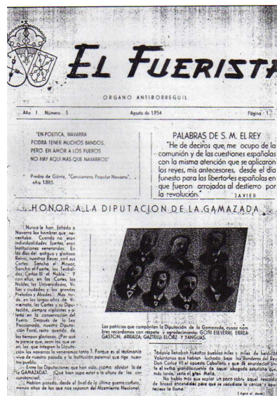
Figura 7: Portada del número de El Fuerista de agosto de 1954, en plena campaña carlista de defensa de los fueros navarros frente a los intentos del gobernador falangista Valero para reducirlos a la mínima expresión.

Con el esbozo que se ha apuntado sobre la filosofía que informaba al carlismo en los tiempos del primer franquismo –y antes–, se podría concluir que se trata de una concepción política de tipo corporativo y ordenancista pero intrínsecamente democrática que, en cualquier caso, se hallaba en las antípodas del régimen autoritario o dictatorial del general Franco.