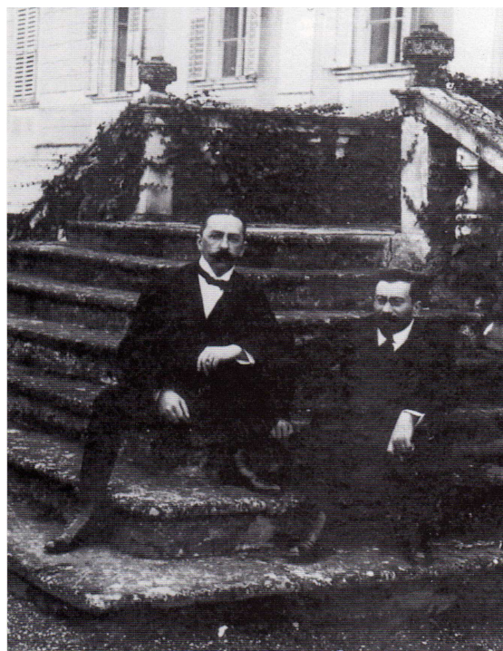
Figura 1. El rey carlista D. Jaime y Vázquez de Mella en la escalinata del Palacio de Frobsdorf, 1909

El modelo político de Vázquez de Mella –inspirador de otros pensadores carlistas de la época de la Guerra Civil, como Luis Hernando de Larramendi, Marcial Solana o Araúz de Robles–, concibe la sociedad como una compleja red de organismos, entidades y agrupaciones intermedias con un funcionamiento autónomo (autárquico, en expresión de los teóricos carlistas, que interpretan este término en su etimología originaria) que prevalecen y son anteriores a la organización jerárquica del Estado. En este sistema interclasista, profundamente impregnado por la religión y la doctrina social de la Iglesia, las principales entidades son los municipios y las regiones (los antiguos reinos), regidos por las leyes históricas y preconstitucionales de los fueros, y su máxima expresión política es la monarquía tradicional de corte federativo, un sistema monárquico más inspirado en la España descentralizada de los Austrias que en la orientación centralista de los Borbones. Más tarde, en los años sesenta del siglo pasado, este modelo inspirará la evolución del carlismo que desembocó, con cierto desconcierto entre parte de las bases carlistas, en el socialismo autogestionario (Martorell, 2008 y 2014).