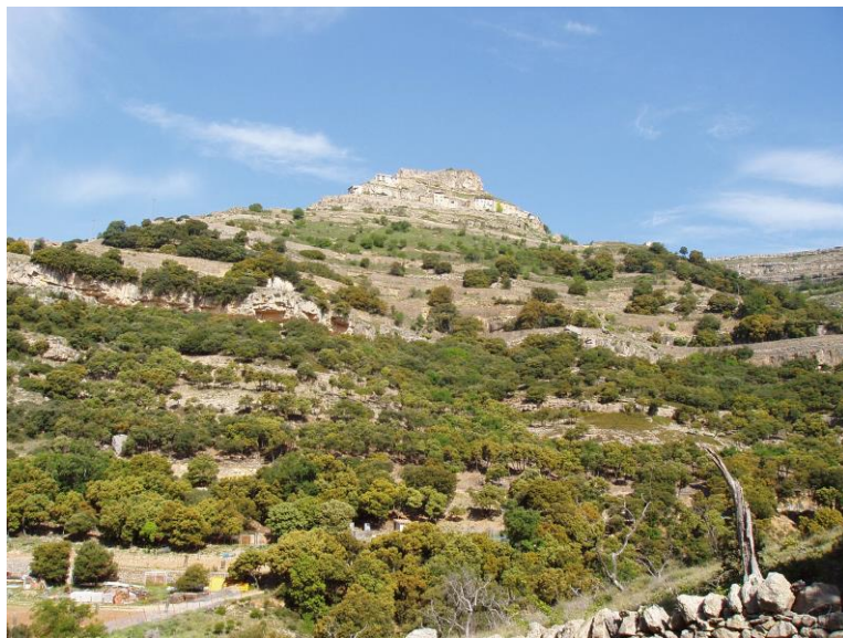
Paraje Natural Mola de Ares 2011

Otro tipo de espacio protegido (cuyo fin es realizar el estudio y seguimiento de la flora y vegetación que acogen, a la vez que se protege) establecido por la Generalitat Valenciana es el de Micro reserva de Flora . Se trata de zonas de pequeño tamaño (máximo 20 Ha.) con un elevado interés botánico. En el conjunto de Els Ports se localizan 30 micro reservas de flora repartidas en los diferentes municipios –La Poble de Benifassà, Ares del Maestre, Cincorres, Vallibona, Villafranca del Cid, Zorita, Morella y Castell de Cabres-.