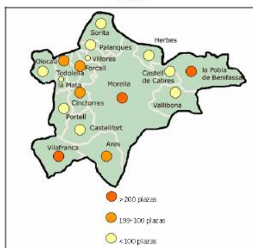
Ilustración VII-4. Distribución de la oferta de plazas de alojamiento en Els Ports