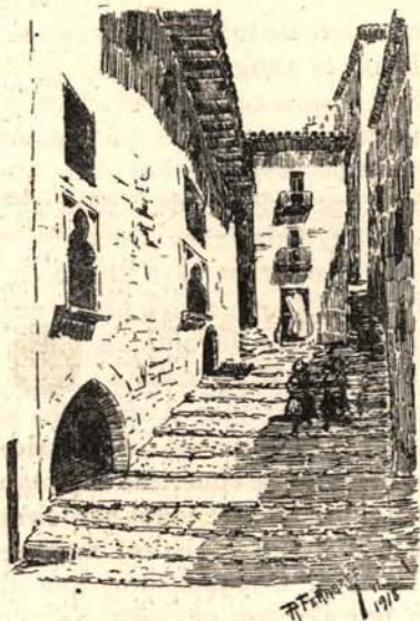
Antigua casa Ciurana, que albergó al Rey Fernando I de Aragón, en su viaje a Morella para entrevistarse con el Papa Luna y San Vicente Ferrer. [25 julio 1414].

Entre los días más gloriosos de la historia de Morella están los del 25 de julio y del 15 de agosto de 1414. No necesito explicarlo: todos sabéis que en esos días estaban reunidos en Morella