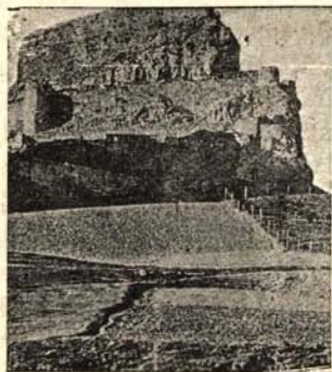
Puerta Ferrisa por donde entró Don Blasco de Alagón y los suyos, evocadora de aquella magna gesta de nuestra Reconquista.

SIEMPRE Morella, ciudad amante y fiel a sus tradiciones como ninguna, ha celebrado con su acostumbrado esplendor y espíritu religioso, la conmemoración de aquel 7 de Enero en que Don Blasco de Alagón con sus ardidés, relevó al imperio musulmán de nuestro castillo substituyendo su dominación islámica por la caridad de la Cruz.