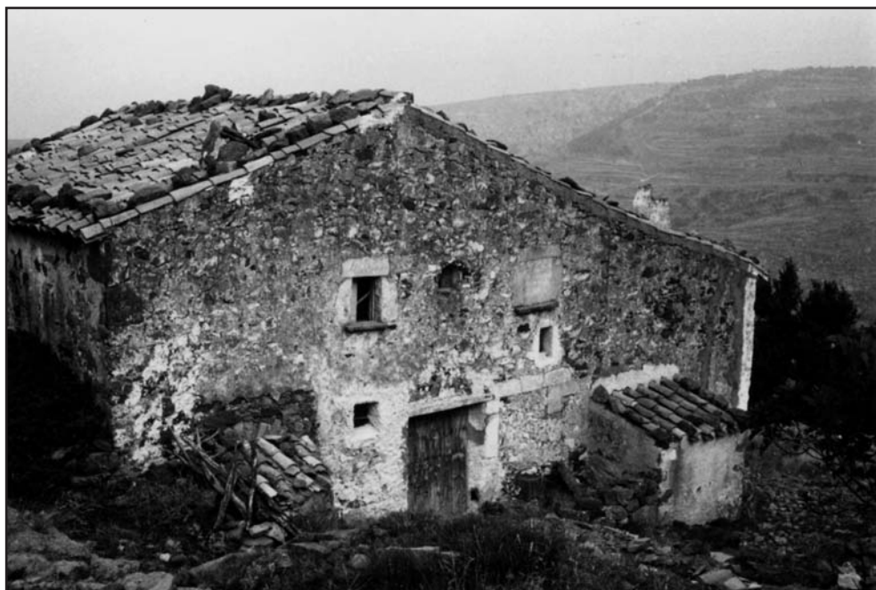
Mas de la Noguereta

En el llistat s'inclou el mas de Llac, que en plànols posteriors queda a terme de Llucena. El mas de Gillida és el que posteriorment s'anomenarà de les Mallades.