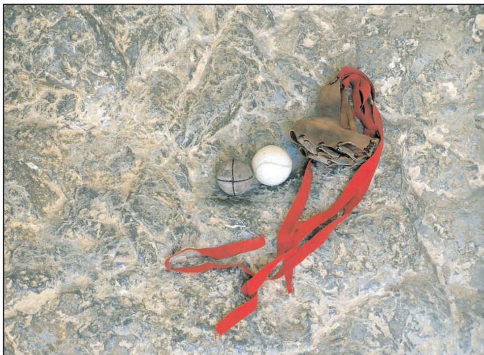
Pilota de vaqueta, pilota de badana i guants

Per a constituir cadascun dels equips que havien de jugar dos dels jugadors es posaven encarats i tiraven peuetes fins que el peu d'un d'ells s'acavallava per damunt del peu del contrari, eixe era qui començava a triar de entre el grup dels que ens havíem congregat per a jugar i així alternativament triaven l'un i l'altre fins que cadascun d'ells formava els seu equip.