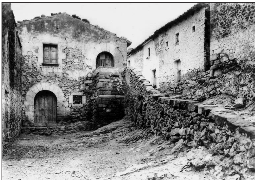
El Dauet. Ajuntament i presó a principis del segle xx.

havia de colpejar per a tornar-la, be de bolea a l'aire o be immediatament després d'haver fet el primer bot en terra, els bots que puguera fer a una finestra o un balcó, o al cap d'un espectador, no comptaven, només comptava el bot que feia a terra. Després de cada joc els equips es canviaven a l'altra part del carrer, de manera que els que havien jugat a la banda del rest en un joc al següent els tocava fer el saque.