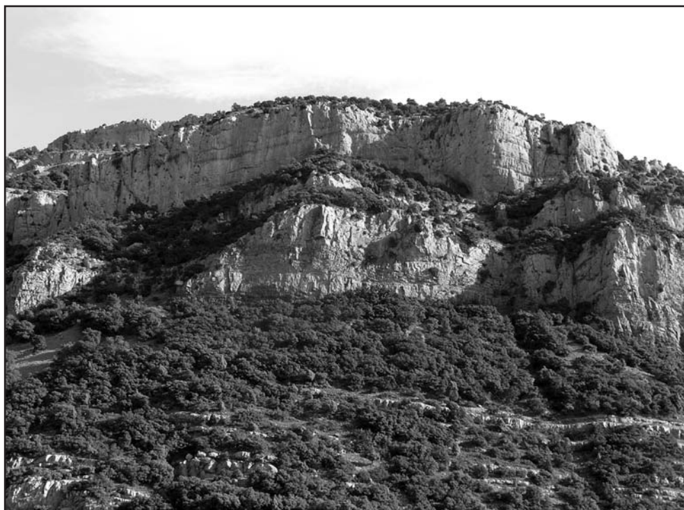
Tossal de Marinet. En ell hi ha indicis d'ocupació de tots els temps

Un poblat del Bronze amb indicis d'una ocupació posterior és el del Collet Roig, a sol ixent del mas de Miravet, en un pujol de la lloma que s'estén cap al barranc Fondo i que té algunes condicions defensives. És un recinte fortificat amb una muralla i una torre en la part amuntera, ara sols un muntó de pedres. Per tot arreu es troben testos de terrissa llisa feta a mà i algun sílex. També algun indici de cagaferro.