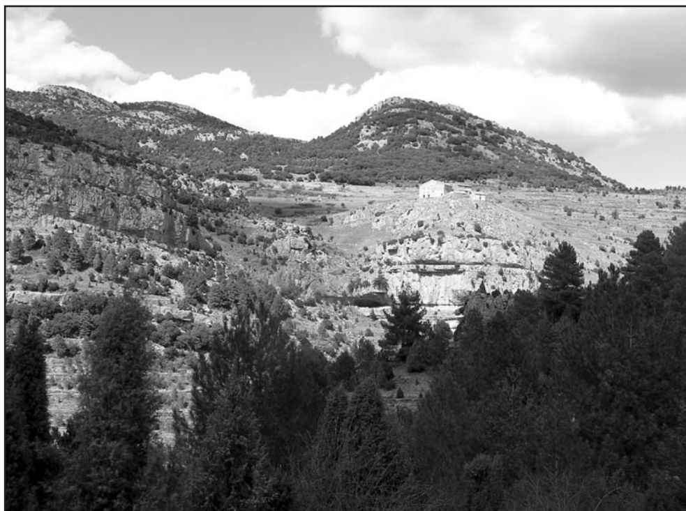
Mas de Gargant. Al cingle, les balmes on es troben les pintures rupestres

fan un ofici de la guerra i els mercenaris ibèrics apareixen en qualsevol lloc on hi haguera un conflicte bèl·lic.