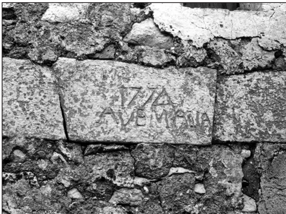
Mas de la Noguereta, detall del dintell