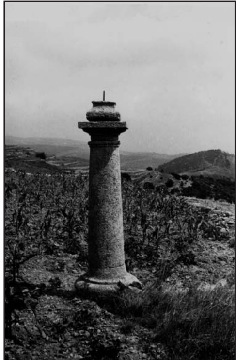
Peiró de Gargant

vant pasos, Mallades y sesters publics y continuads en los actes dela Vila = Al mateix Carrera seli carregue per via de renta añal la de vinticet lliures sis sous y set diners per la que cobre del mas de Franco. Montoliu nomenat antigament lo Mas del Collado de Tarrega,